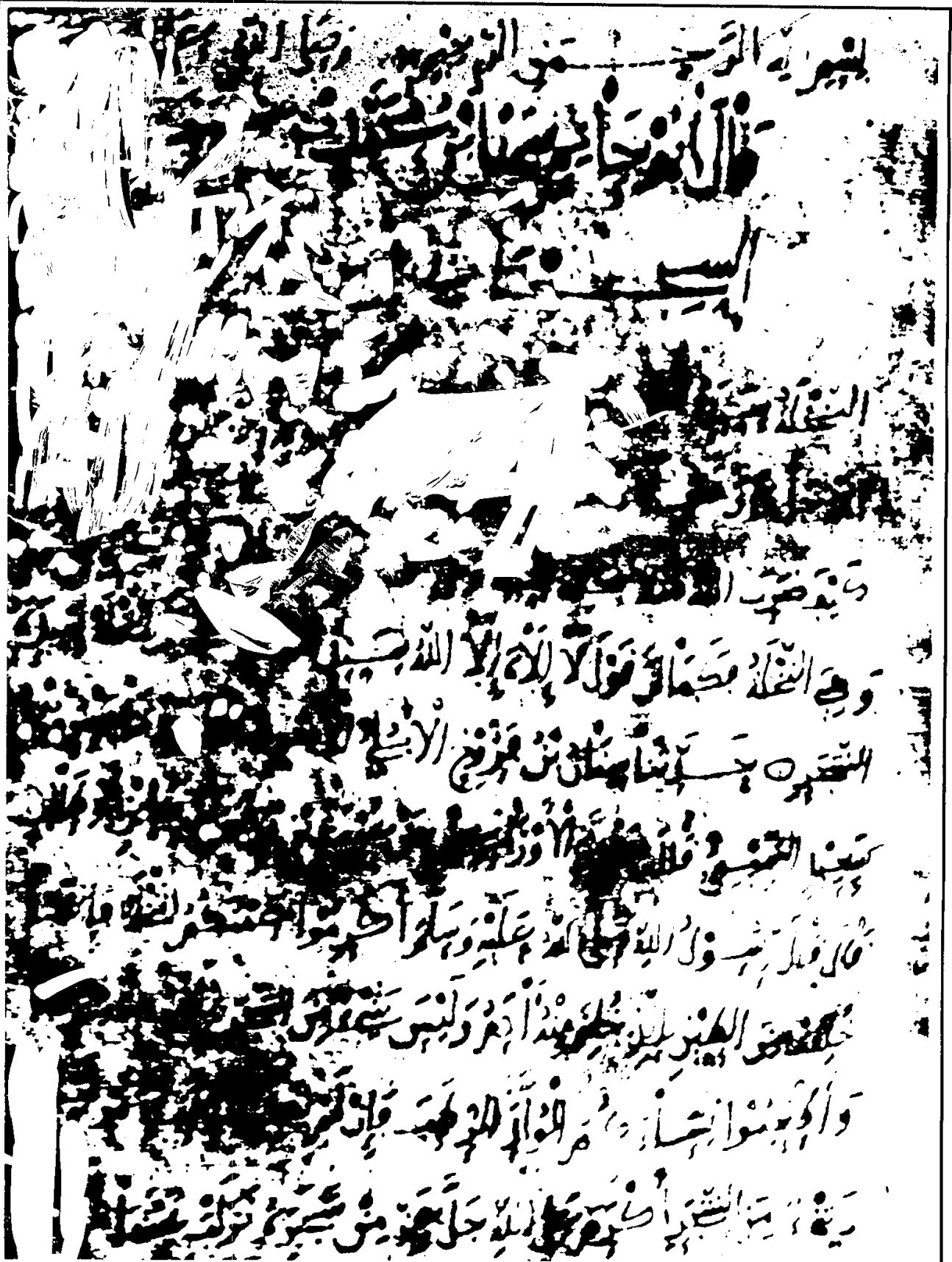
صورة الصفحة الأولى من المخطوط