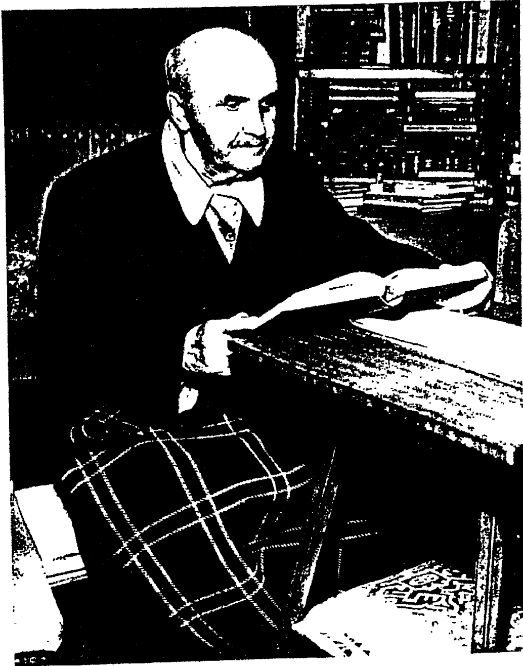
george santayana in 1950