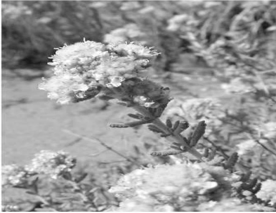
الشكل يبين نبات الجعدة Teucrium polium في مرحلة الإزهار