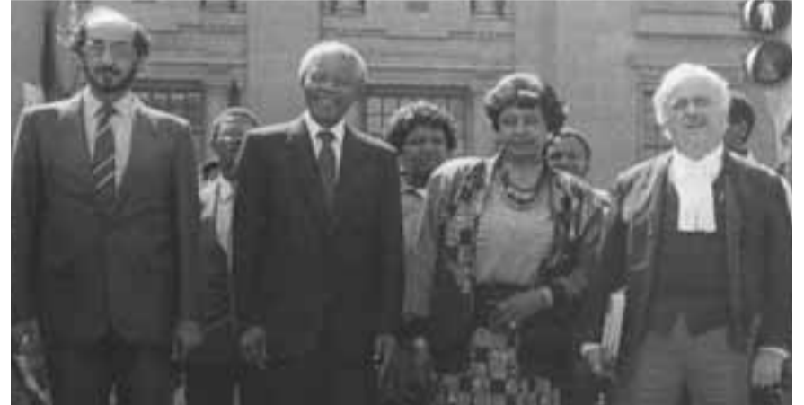
مانديلا وويني مع المحامين إسماعيل أيوب وجورج بيزوس أثناء محاكمة ويني سنة 1991 لاختطافها ستومبي سيببي

مطلوب منا أن نشارك في النضال النهائي لإنهاء نظام التمييز العنصري الشرير. للخطات التاريخية قادمة بسرعة. ليس بعيداً من الآن سوف يقف شعب جنوب إفريقيا ليعلن أن نظام التمييز العنصري في جنوب إفريقيا وهو رأس العنصرية في العالم قد ولى، وأن السلطة آلت إلى أيدي الشعب بكامله (...).