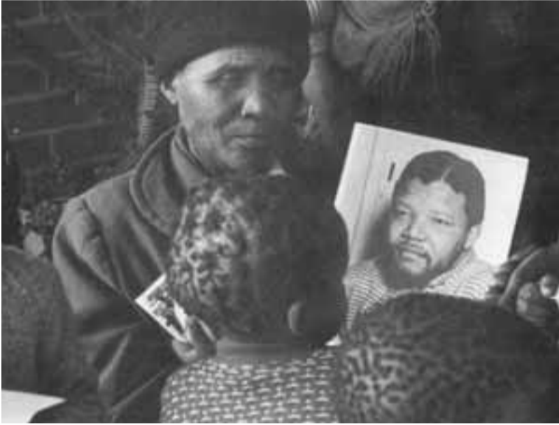
والدة مانديلا تحمل صورته أثناء محاكمته سنة 1964

إنه وقت الإحتفال، وعلى الجنوب إفريقيين أن يحتفلوا معاً بولادة الديمقراطية. أرفع كأساً لكم جميعاً للعمل بجد من أجل إنجاز ما يمكن أن نسميه معجزة صغيرة، فليكن احتفالنا بالحفاظ على المناخ المسالم والمحترم والمنضبط الذي ساد في الإنتخابات، وأن تظهر أننا شعب جاهز لتحمل مسؤوليات الحكم. أعدكم أن أقوم ما بوسعي لأن أحترم الثقة التي منحتوني إياها ولحزبي المؤتمر الوطني الإفريقي. فلنبن معاً مستقبلاً ولنشرب نخب حياة أفضل لجنوب إفريقيا.