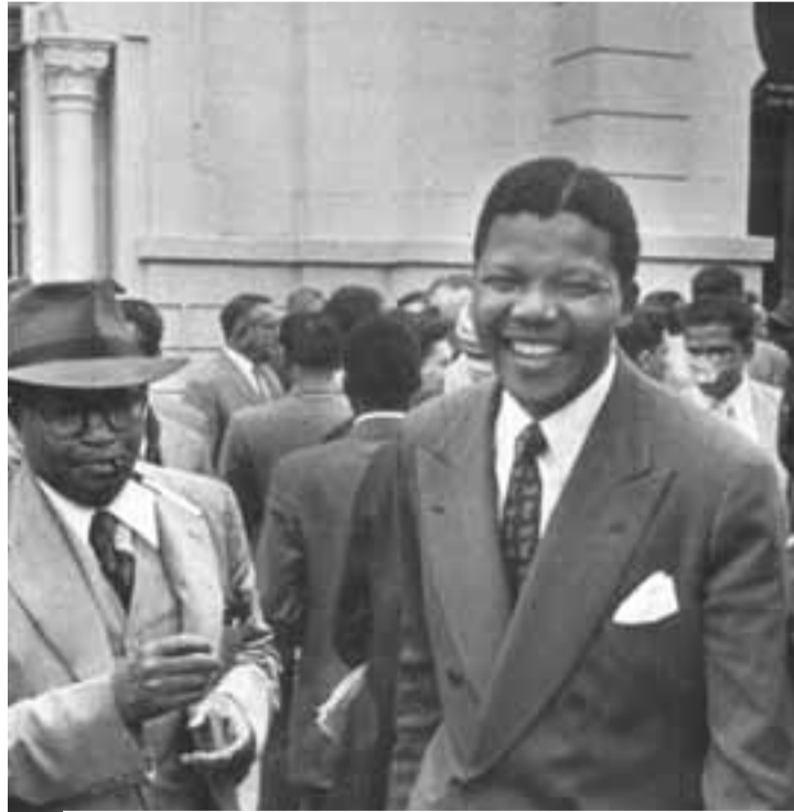
في « قضية الخيانة » سنة 1958

يجب ان نلفت انتباهكم أيضاً إلى أن حركتنا وشعبنا يحتاجون إلى موارد عديدة ليتمكنوا من تحقيق أهدافهم. تقع علينا مسؤولية إعادة بناء المؤتمر الوطني الإفريقي كحزب شرعي بعد ثلاثين عاماً من