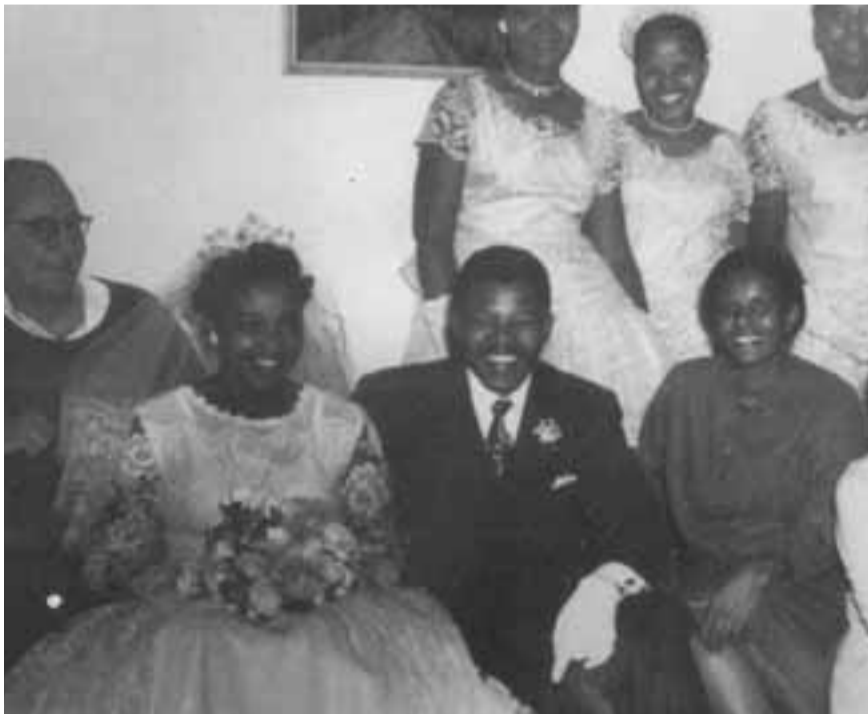
زفاف مانديلا لعروسه الثانية وبيني في سنة 1958

وقد شهدت زيارة الدولة التي قام بها الرئيس كلنتون إلى بلادنا على قوة علاقاتنا. إن الترحيب الحار الذي لقيه من شعبينا يعبر عن المكانة الخاصة لشعب الولايات المتحدة في قلوب الجنوب إفريقيين. كما أن إتساع علاقاتنا يجعل من الولايات المتحدة شريكاً لا يمكن الإستغناء عنه في تحقيق التحسينات المادية لحياة شعبينا، خصوصاً الفقراء، والتي بدونها تبقى ديموقراطيتنا فارغة واستقرارها هشاً. مع ذلك نحن بحاجة لأن نتذكر أنه كلما حققنا تقدماً في تغيير حياة شعبينا نحو الأفضل يجب أن تكون الإستجابة