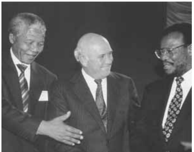
إلى اليمين زعيم الزولو بوتيليزي يرفض مصافحة مانديلا وديكليرك