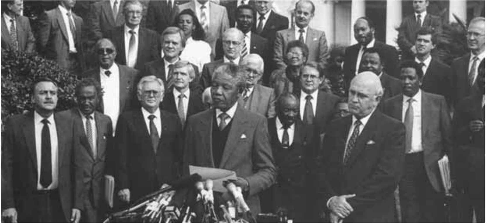
في اللقاء الأول بين المؤتمر الوطني الإفريقي والحكومة في أيار (مايو) سنة 1990

(كلمة أمام البرلمان السويدي/ استوكهولم في 13 آذار/ مارس 1990)