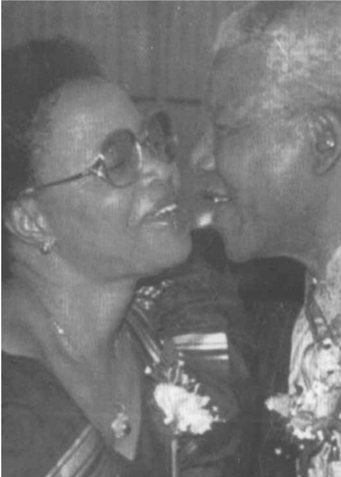
مانديلا مع زوجته الثالثة غراكا ماتشيل