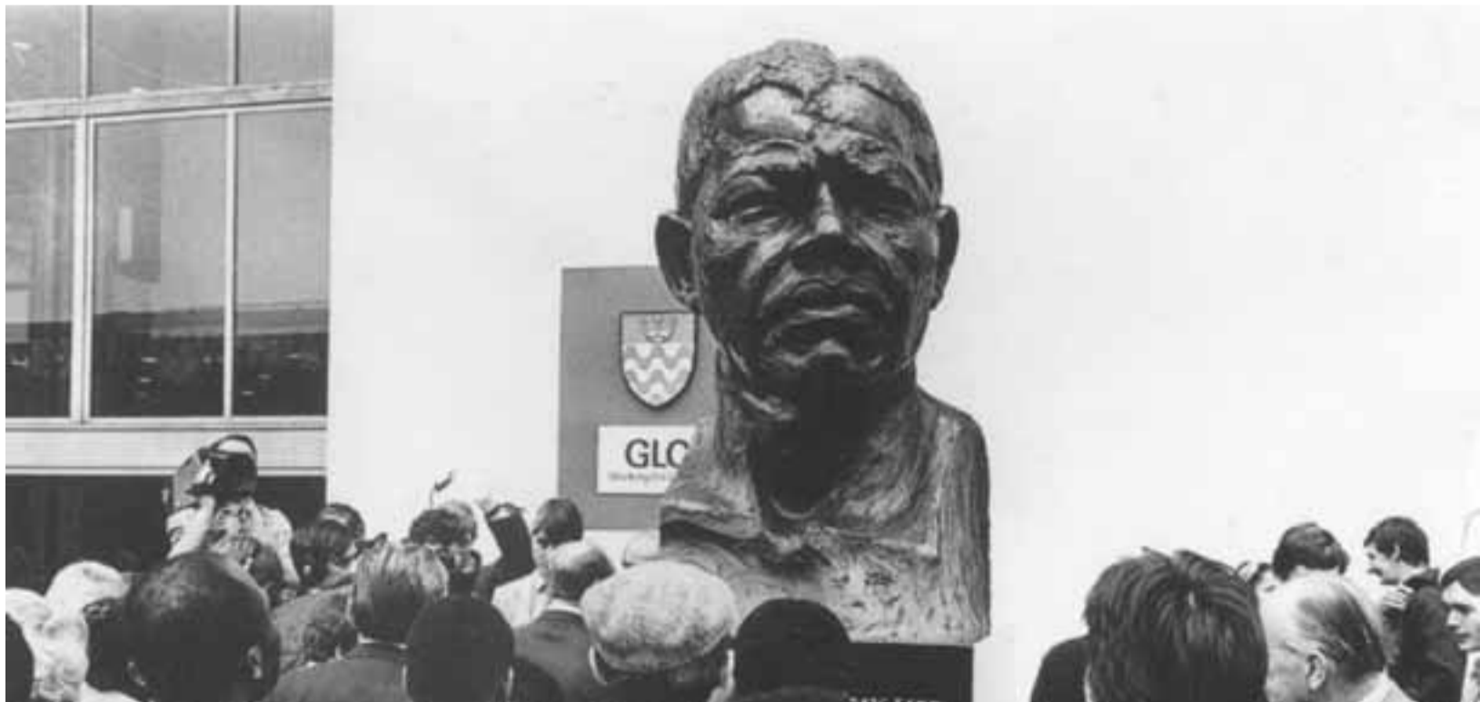
تمثال لمانديلا في لندن أنجز سنة 1985

بينما نحتفل اليوم بعيد الفطر، وبينما نحصد ما زرعناه في رمضان وبينما نظهر كيف أغنى الإسلام أمتنا وكيف احتضنت بدورها المسلمين كأبناء لها، نشعر بالحزن لأن الجهل بالإسلام وتجاهل المسلمين في أفريقيا وغيرها ما يزال يستخدم لإذكاء النزاعات والتوترات. مع أن الأديان تتعرض لسوء الاستخدام في هذه الأيام، يمكننا أن نتحد وتفرض احترامها لبعضها البعض. وأنا أعتقد أنه بإمكان المسلمين أن يسهموا بشكل خاص في بناء أفريقيا أكثر إنسانية وذلك باستخدام المواقف المبدئية في عقيدتهم وتراثهم. إعترفت إفريقيا بالإسلام ديناً منذ أن منح الملك الأفريقي المسيحي «نيفوس» الحماية لاتباع النبي محمد. ومثل هذا الاحترام والتعاون يدل على الدور الذي يمكن أن يلعبه