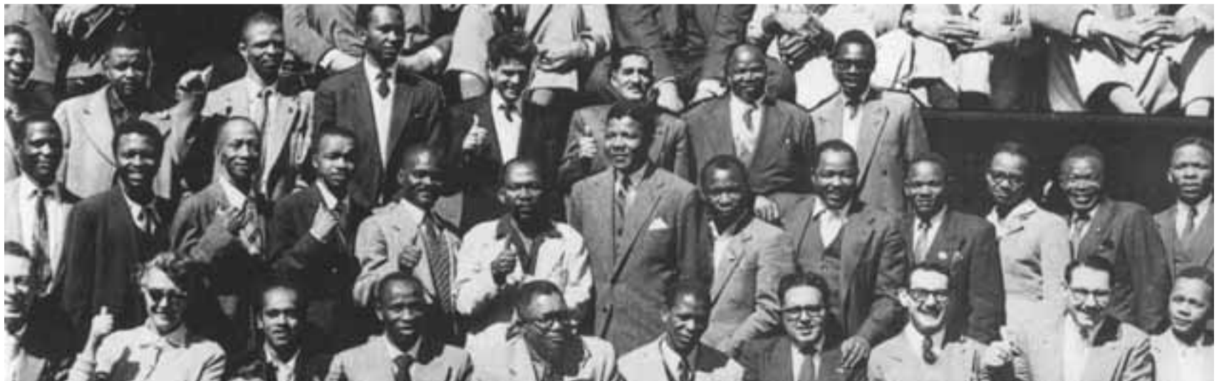
مانديلا مع المتهمين في قضية الخيانة التي بدأت سنة 1957

إنه ذلك التاريخ الذي يجعلنا نعتبر المهاتما غاندي الخالد بطلنا القومي، إنه التاريخ الذي دفعنا وما يزال للبحث عن المثل الذي نحتذيه لبناء بلدنا. إنه ذلك التاريخ الذي جاء بانديرا غاندي ابنة جواهر لال نهرو إلى بلادنا حيث زارتها عندما كانت شابة، إنه التاريخ الذي جاء بي إلى الهند البلد الحافل بالنضال ضد جريمة نظام التمييز العنصري.