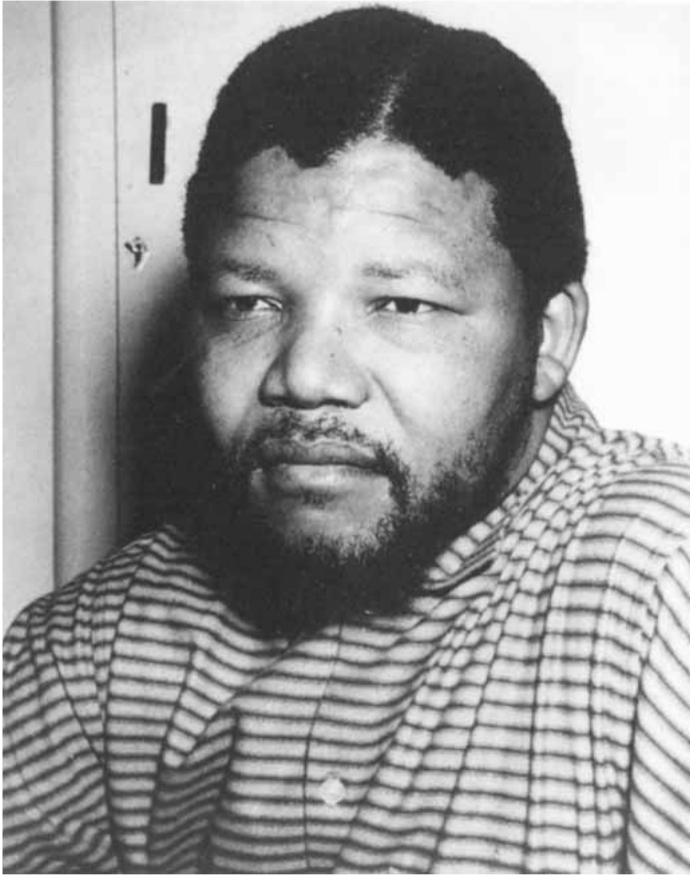
نيلسون مانديلا ملتحمياً