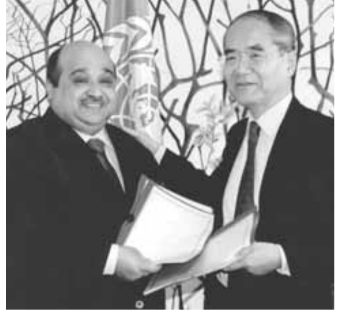
سعادة السيد كويشيرو ماتسورا Koichiro Matsuura مدير عام اليونسكو ومعالي الشيخ محمد بن عيسى الجابر MBI Al Jaber