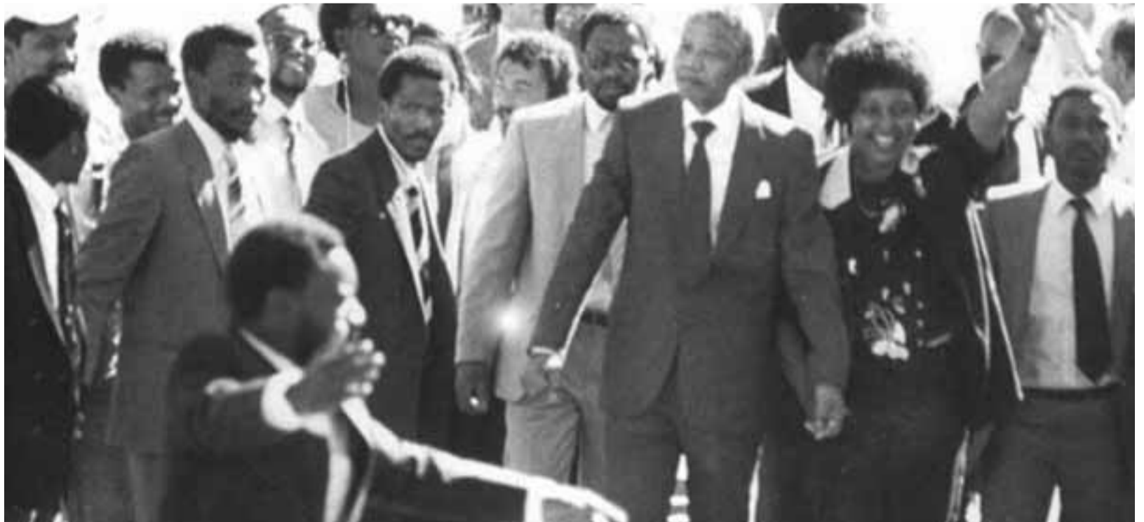
مانديلا خارجاً من السجن

بينما كنا نراقب أعين الذين يقمعون ويعدبون سنة بعد أخرى ونشعر بالآلام الناتجة عن