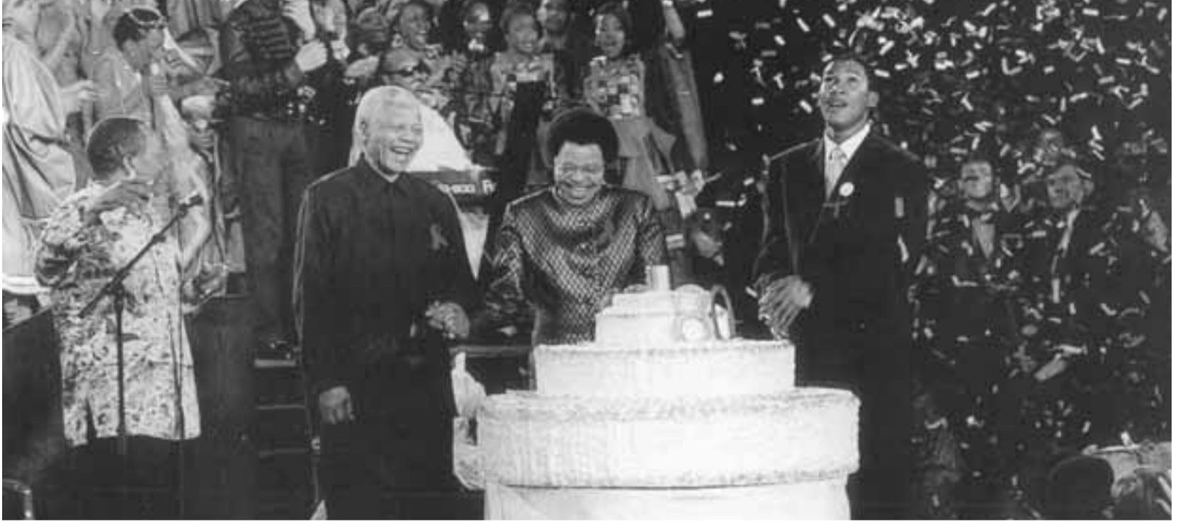
في عيد ميلاده الثمانين سنة 1998

(خطاب موجّه الى أهالي كيب تاون وجراند باراد في مناسبة رئاسة الدولة / كيب تاون في 9 أيار/مايو 1994)