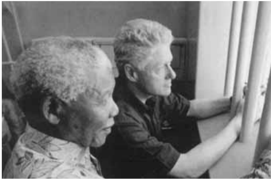
مانديلا يصطحب الرئيس كلينتون في زيارته القديمة في جزيرة روبين

نحن نعيش في عالم يوجد فيه أسباب كافية لليأس والسخرية، نحن نرى دولتين ديمقراطيتين