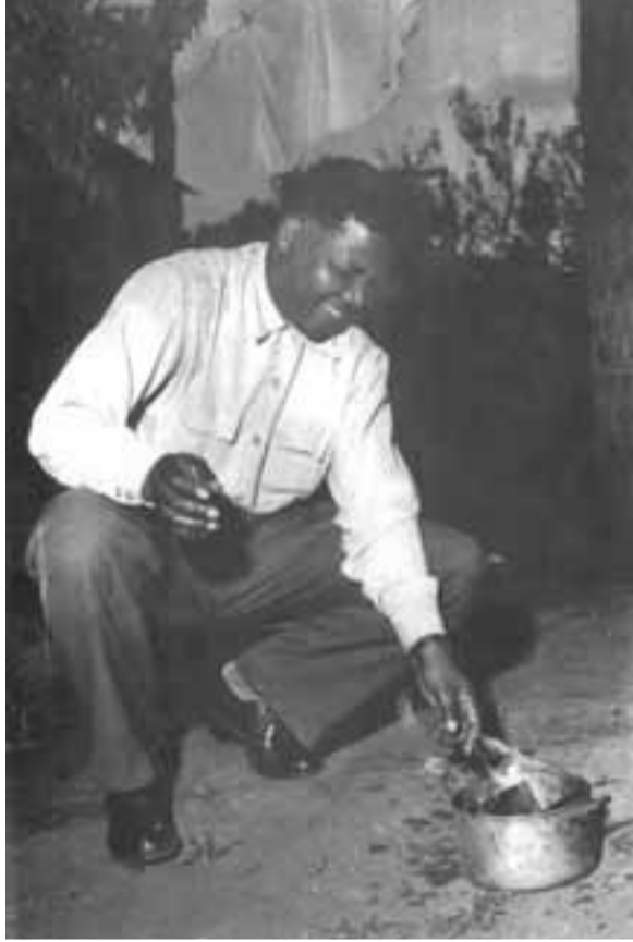
في عيد ميلاده الثمانين سنة 1998

ونضع بتصرفهم كل الموارد المتوافرة. ونقدم لهم الدعم والثقة بكل ما يقومون به من جهود في هذا المجال. وأعطينا توجيهاتنا بأن تراعي كل الوزارات هيكلية شروط إتفاق السلام الوطني بحيث يتماشى مع مهمتهم النبيلة في الظروف الجديدة.