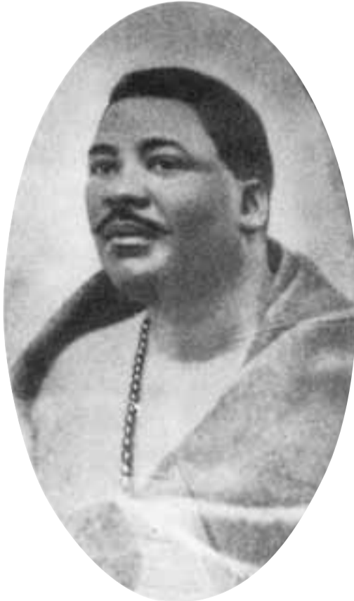
الزعيم جونجيينغ دالينديو الوصي على مانديلا خلال معظم أيام شبابه

تشرفت عام 1992 بمنحي دكتوراه فخرية من جامعتكم، إنه أمر غير عادي وفريد وشرف لي أن ألقى دعوة اليوم كزيرج شرف وأن أتحدث أمام هذه المؤسسة التعليمية المميزة.