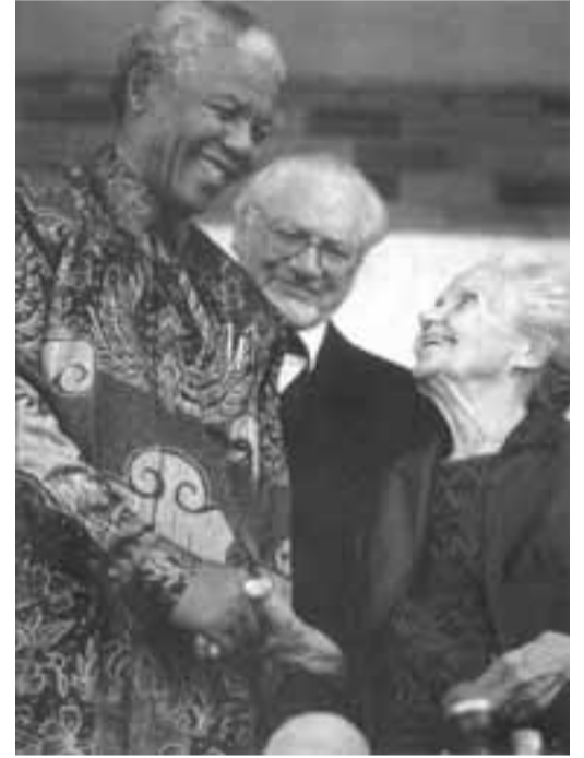
مانديلا وأرملة هيندريك فير وورد في الرابعة والتسعين من عمرها

(خطاب في مناسبة تسلمه جائزة نوبل - أوصلو - النروج / في 10 كانون الأول / ديسمبر 1993)