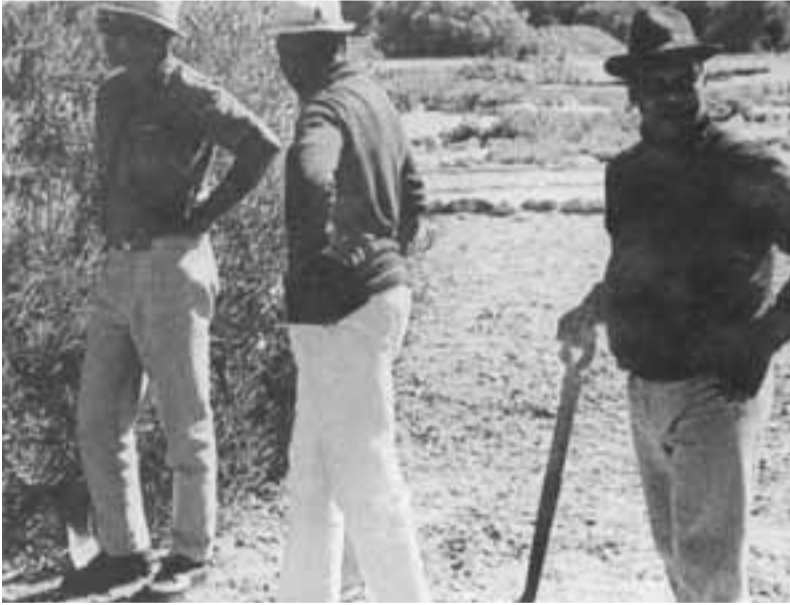
مانديلا في جزيرة روبين