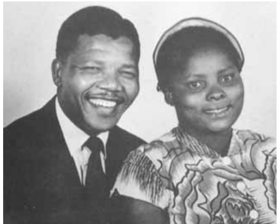
في سنة 1944 تزوج مانديلا في جوهانسبورغ من إيفلين ميز