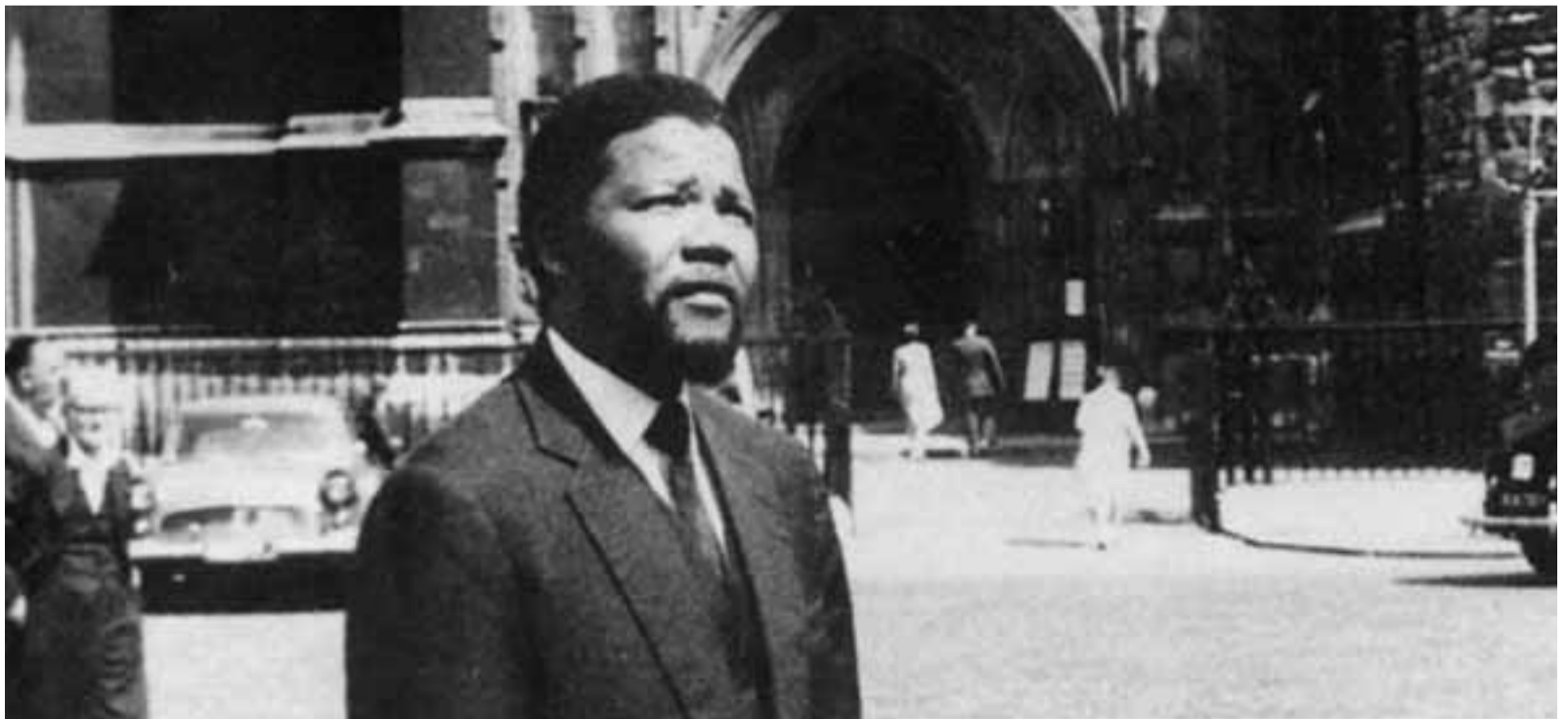
مانديلا في لندن في حزيران (يونيو) 1962

إن عنف النظام الإجتماعي قد ولد بطالة واسعة وفقراً وموتاً من الجوع. في هذه الظروف لا يمكن تجنب النزاعات العنيفة.