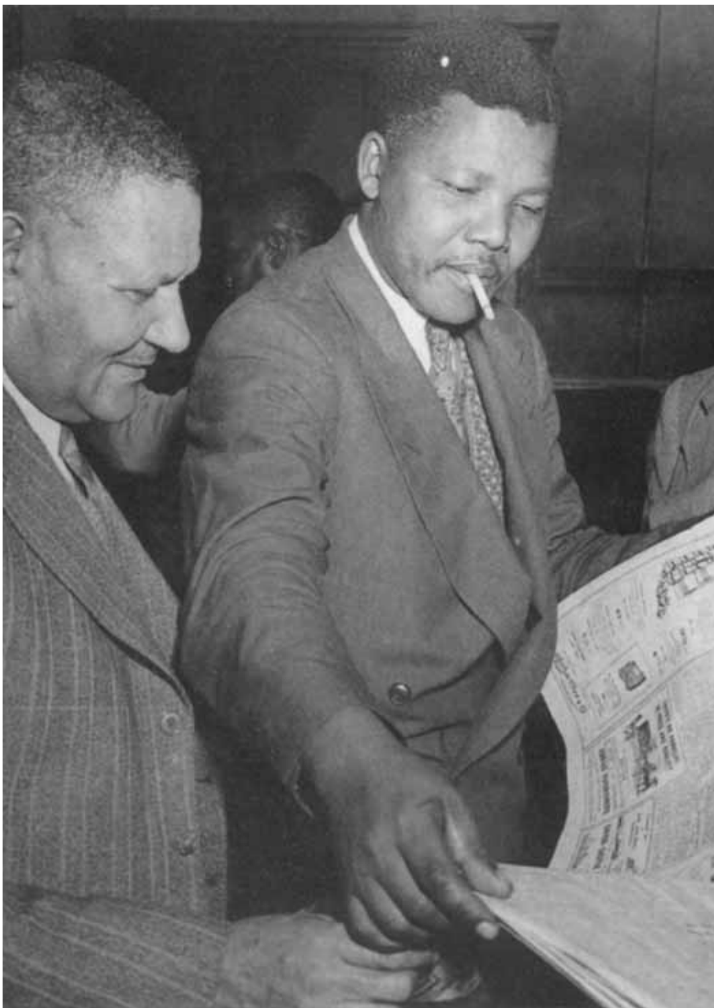
مانديلا خلال حملة التحدي سنة 1952