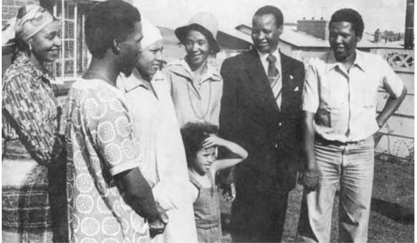
ويني مانديلا (إلى أقصى اليسار) تستقبل زواراً في سويتو

(كلمة مانديلا بصفته رئيساً لجمهورية جنوب أفريقيا الديمقراطية - بريتوريا في 10 أيار/مايو 1994)