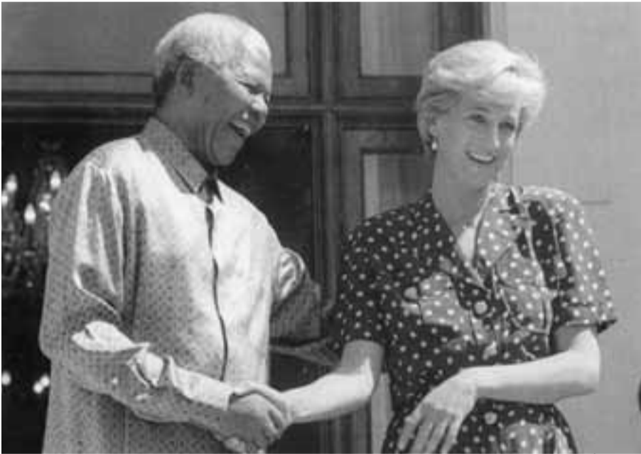
مع الأميرة ديانا

ونطالب القادة الأكاديميين وفي الاعلام والقطاعات الأخرى بأن ينضموا إلينا لكي نضمن أن العالم يحترم تعهداته تجاه الأطفال. وليكونوا يقظين من أجل محاسبة الحكومات والنضال من أجل العدالة والسلام. لا تهدروا أية لحظة لأنه لا يمكن تحت أي ظرف التسامح في إهمال الأطفال أو إساءة معاملتهم.