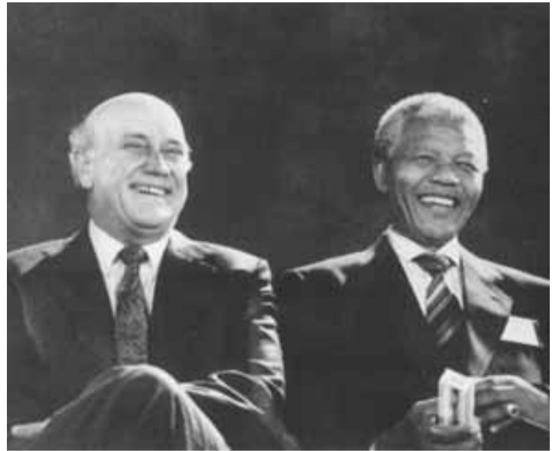
مانديلا مع ديكليرك

في سياق نضالنا الدموي أقمنا روابط بين شعب جنوب أفريقيا والشعب الفرنسي، ونحن مقتنعون تماماً أن جنوب أفريقيا في مرحلة ما بعد إنهاء نظام التمييز العنصري سوف تسودها الصداقة والتعاون وروح التضامن بين شعبينا. ولهذا ندعوكم إلى القيام بمساهماتكم الحيوية من أجل وضع حد لهذه الجريمة ضد الإنسانية. لقد طال زمن التمييز العنصري وأطاح بحياة الكثيرين.. يجب أن ينتهي التمييز العنصري، يجب أن ينتهي الآن.