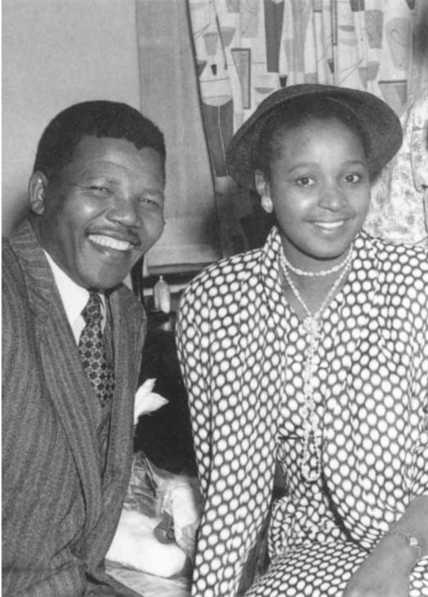
مع زوجته الحسنة المناضلة ويني