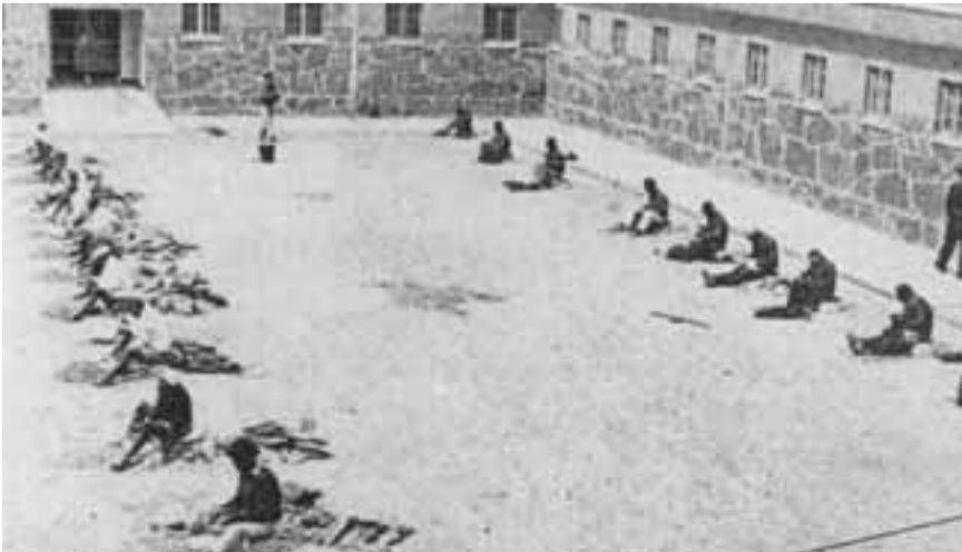
سجناء من ضمنهم مانديلا في باحة السجن في جزيرة روبين سنة 1965

وفي الختام أود أن أقتطف كلمة قلتها أثناء محاكمتي عام 1964 وهي صحيحة اليوم كما كانت وقتئذ : «لقد قاتلت ضد هيمنة البيض كما قاتلت ضد هيمنة السود. أحبي مثال المجتمع الديمقراطي الحر حين يعين الجميع سوية وفق فرص متساوية ويتناغم تام. إنه لمثال أتمنى أن أعيش لأراه يتحقق، ولكن إذا دعت الضرورة فإنه مثال أستعد لأن أموت من أجله».