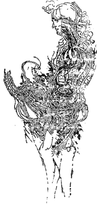
رسم ليونارد لعمالية الجماع Quad, Anat III.Fol. 3 V.

على الوجه الآتي : « إن فشل ليونارد في نقل صورة صحيحة لعملية التكاثر يعود لسكبه الجنسي الشديد ، فهو يرسم جسم الرجل كاملاً ثم يصور جزءاً بسيطاً من جسم المرأة وإذا أمعنا النظر في الرسم مع تغطية جزئه الأسفل ، لتبيننا التوجعات الجببية الممتدة لظهور والتي تعطي للوجه سمات سيدة وكذلك نجد خطاً بين ظاهريين في ثدي المرأة ، أولهما من الناحية الفنية حيث يبدى الثدي متهدلاً على الصدر في صورة غير مرضية ، وثانيهما من الناحية التشريحية ، فلقد فات ليونارد لإزاء تجنبه للناحية الجنسية أن ينظر بنظرة فاحصة للحالة ، فلو أنه فعل ذلك لتسكن من معرفة أن لبن الرضاعة يفرز من عدة قنوات لبنية وليس من قناة واحدة عند «تجويف الجلي» ، وتستطيع إعطاء العنبر ليوناردو لصعوبة التشريح الجسدي في هذا العصر ، إذ كان يمرضه ذلك لعقاب القانون . وإذا تمكنا من التسماع لإزاء قلة معرفته التشريحية ، فالحقيقة واضحة بأنه أهمل دائماً أعضاء الأثني التشريحية في صورته ، وأكثرت اهتمامه على أعضاء الذكر فبرسم الحصى ومحتوياتها بتفصيلات دقيقة ، والوضع المنتصب الذي اختاره ليوناردو لتصوير عملية الجماع الجنسي شيء نادر في عمل فني يدل على عمق السكبت الذي يعانیه ، والذي جعله يختار هذا الوضع العجيب - فمنعنا يريد الإنسان أن يتمم بخيار نفسه وضماً مريحاً لسكى يهين نفسه المنفعة القسوى . زد على ذلك ما نراه في وجه الرجل من تجاعيد حواجبه ، ونظرته الجانبية ، وحشوته المضطربتين ، وتمبير الاشتزاز والتكبر المرئسة على وجهه بدلا من شبق الحب وسعادة الاغراق في اللذة .