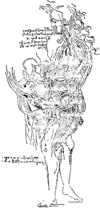
صيغة فرت Wehrh لرسم ليوناردو لعملية الجماع وهي نقل غير دقيق لنقش بارنلوزي Bartolozzi وقد اعتقد في فرويد في أسالة الرسم

الصراع شديد في هذا العصر بين الشهوانية المنطلقة والزهد السكتيب ، ولم يتوقع أحد من فناني عصر جمال المرأة ، أن ينبذ الجنس كما فعل ليوناردو ، وقد استشهد سولي كدليل لبروده الجنسي بقوله « إن عملية الإنجاب وكل متعلقاتها تثير الاشمزاز ، ولولا وجود الوجه الحسن ، والطابع الشهوانية وهي عادة قديمة التداول ، لهلكت البشرية » .