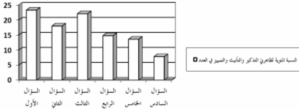
الشكل رقم (٢). النسبة المئوية لظاهري التذكير والتأنيث والتمييز في العدد.

تمثل الأسئلة الأربعة الأولى : ظاهرة التذكير والتأنيث في العدد. ويلاحظ أن الطلاب أكثر من الأخطاء في السؤالين الأول والثالث ، وكانت تلك الأخطاء أكثر من السؤالين الثاني والرابع ، بلغت نسبة مئوية مرتفعة (٧٨,٥ ٪). بينما يمثل السؤالان الخامس والسادس : ظاهرة التمييز ، وكانت الأخطاء في السؤال الخامس أكثر منها في السؤال السادس كما يشاهد من الشكل أعلاه ، بلغت نسبة (٢١,٥ ٪) من إجمالي الأخطاء.