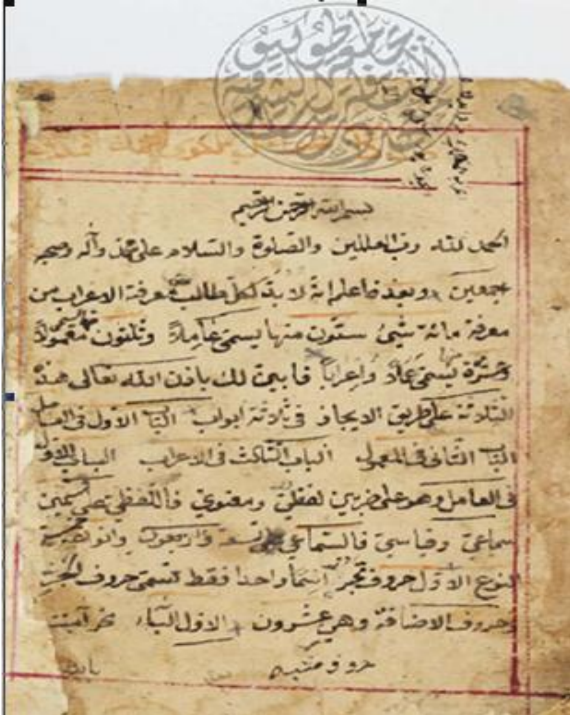
الصفحة الأولى من نسخة ( أ )