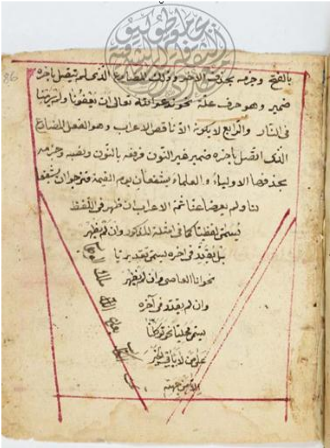
الصفحة الخيرة من نسخة ( أ )