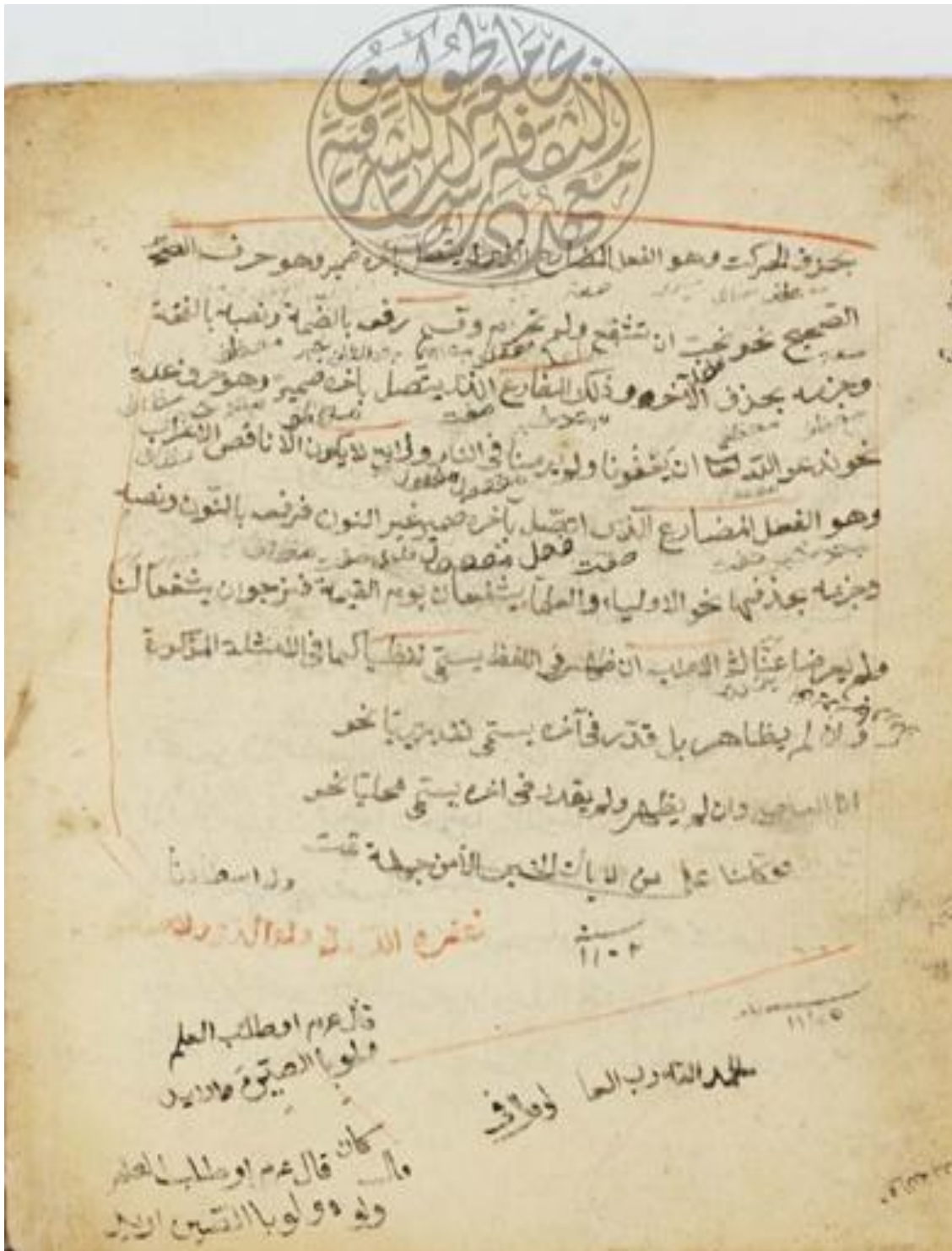
الصفحة الأخيرة من نسخة ( ج )