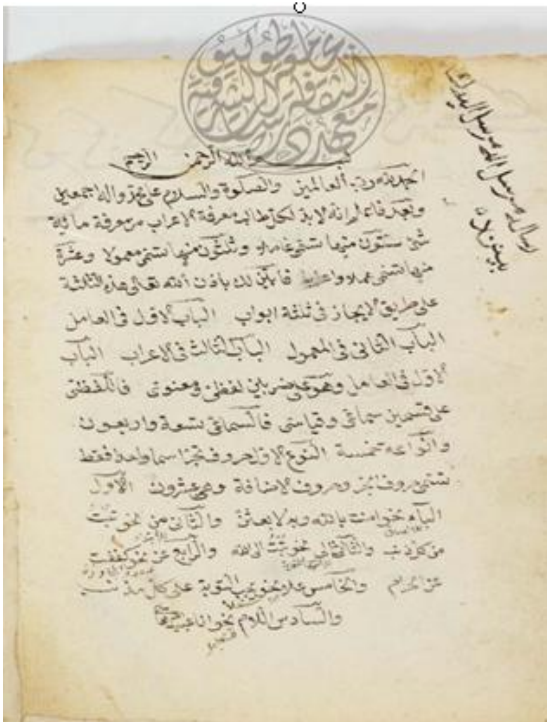
الصفحة الأولى من نسخة ( ج )