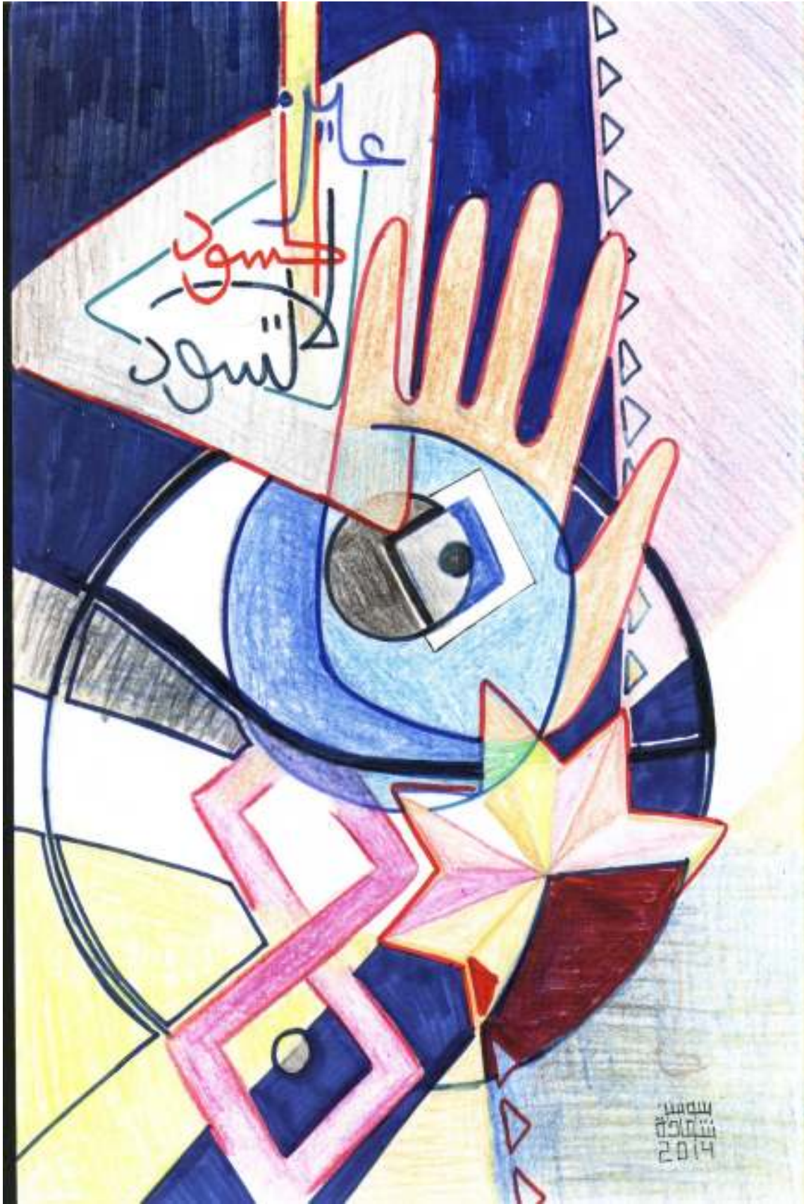
أسطورة العين في اللغة والفكر