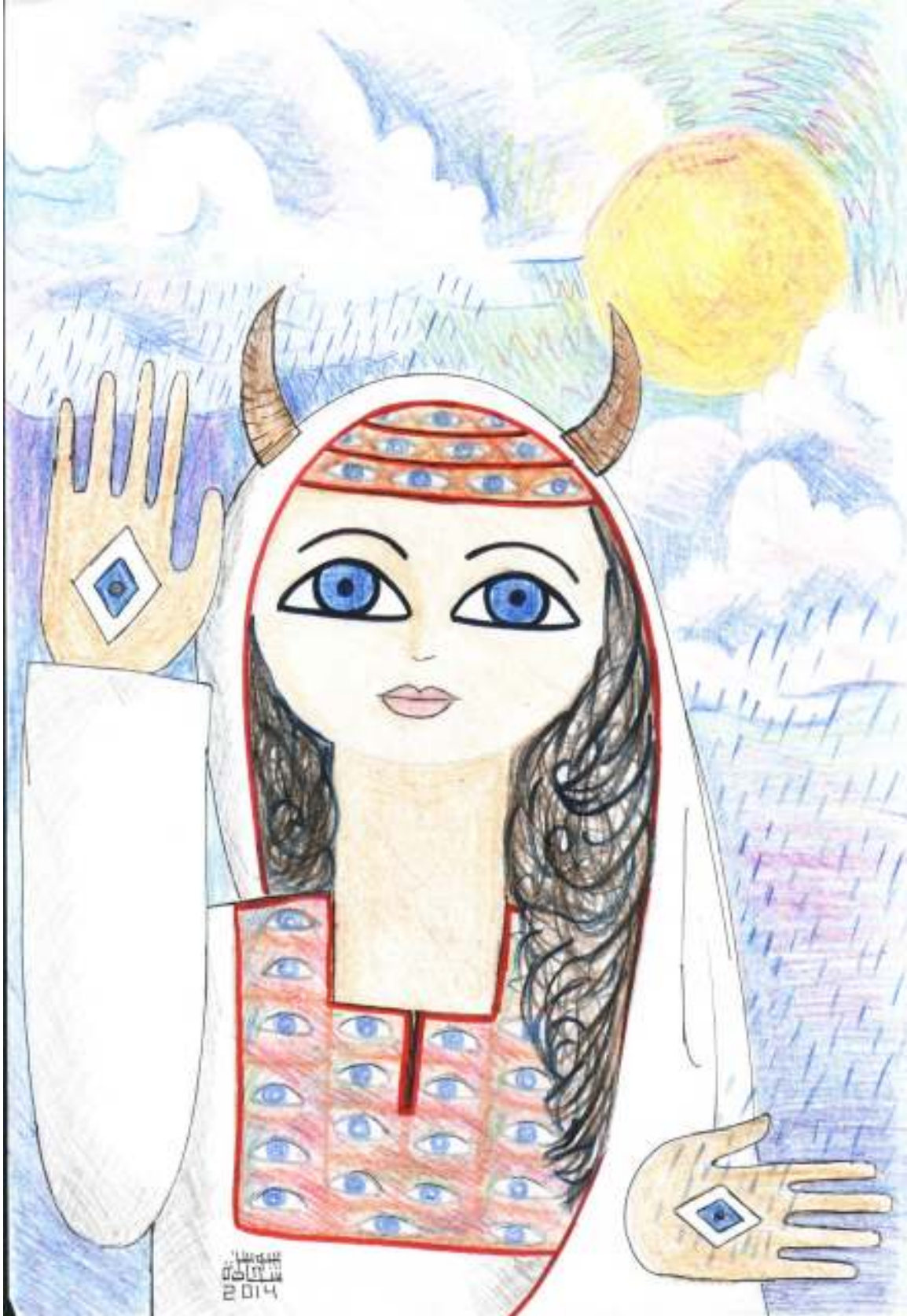
أسطورة العين البشرية في الشعر الجاهلي