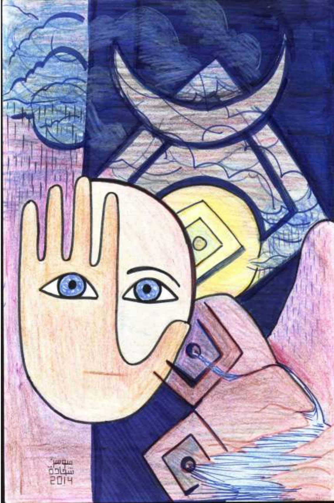
أسطورة العين الحيوانية والظواهر الطبيعية في الشعر الجاهلي