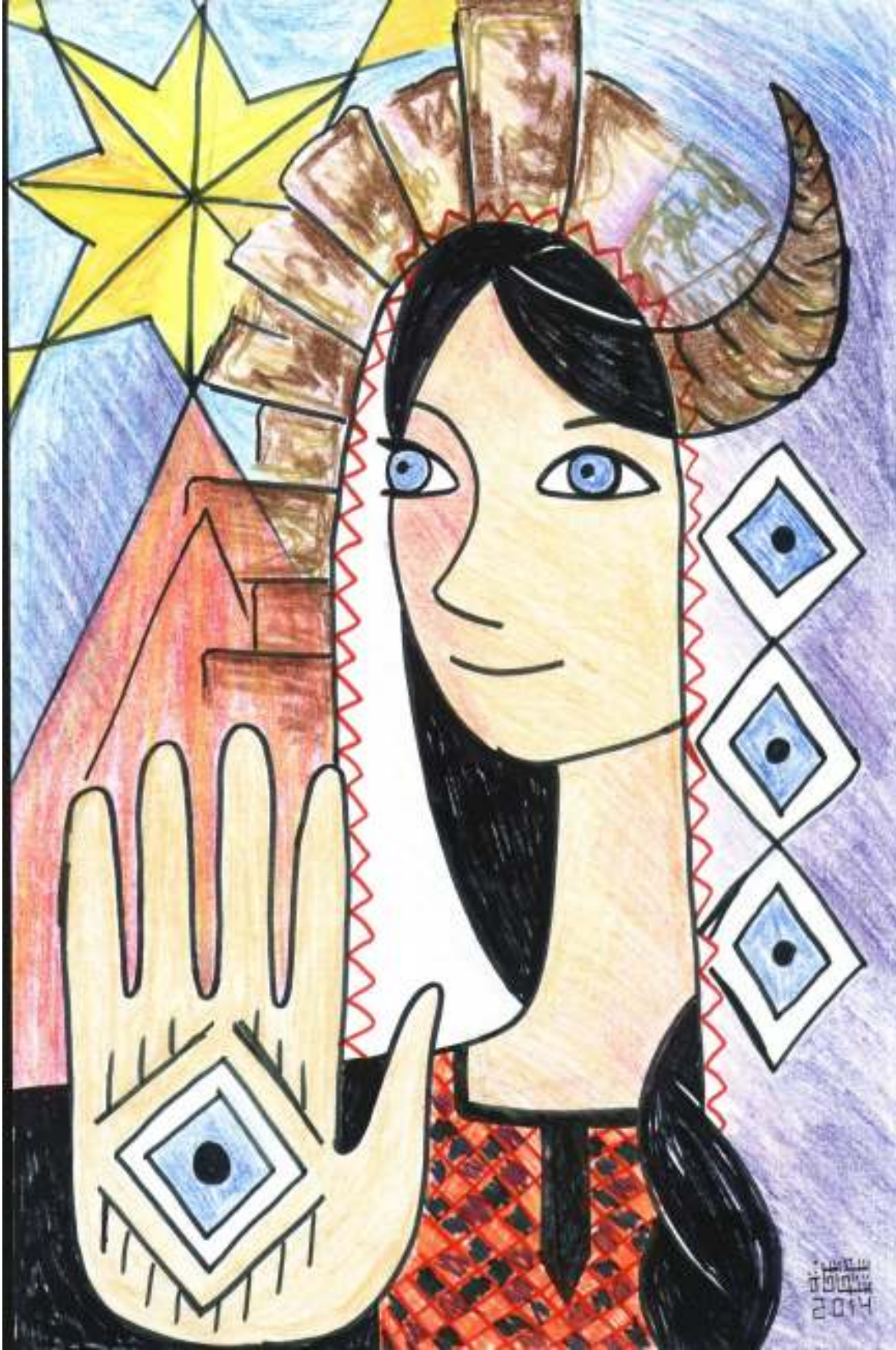
أسطورة العين البشرية في الشعر الجاهلي