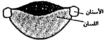
( أ ) التضيق الأخدودي اللسان يتخذ شكل الكوب

ويقع التفشي تحت النوع الأخدودي حيث يتخذ اللسان صورة الكوب،