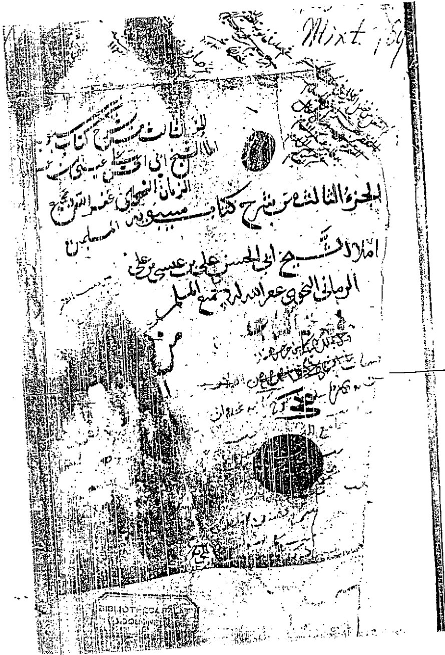
صورة الغلاف من (نسخة فينا)