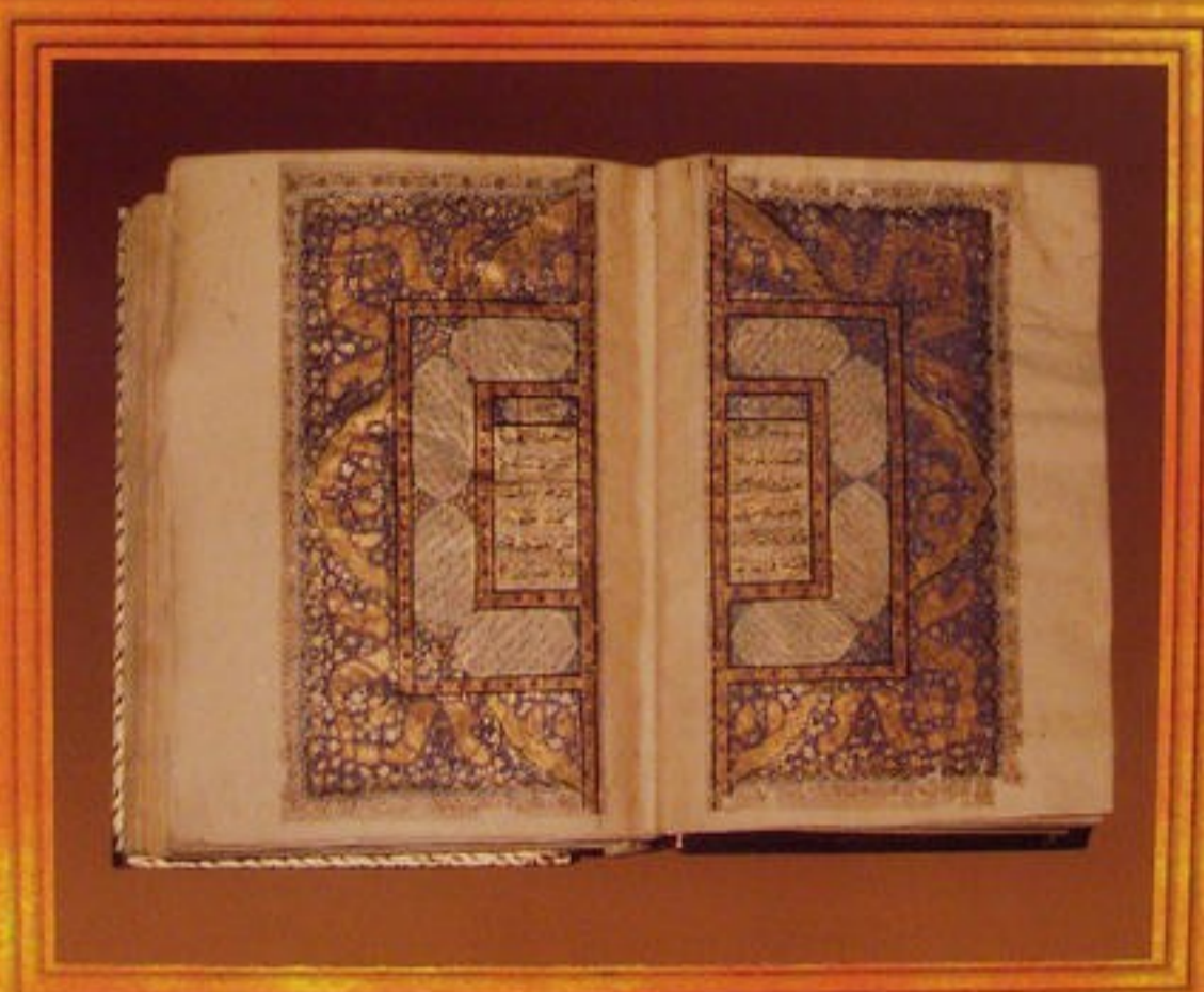
A copy of the Holy Quran written in the year 1268 after Hijra