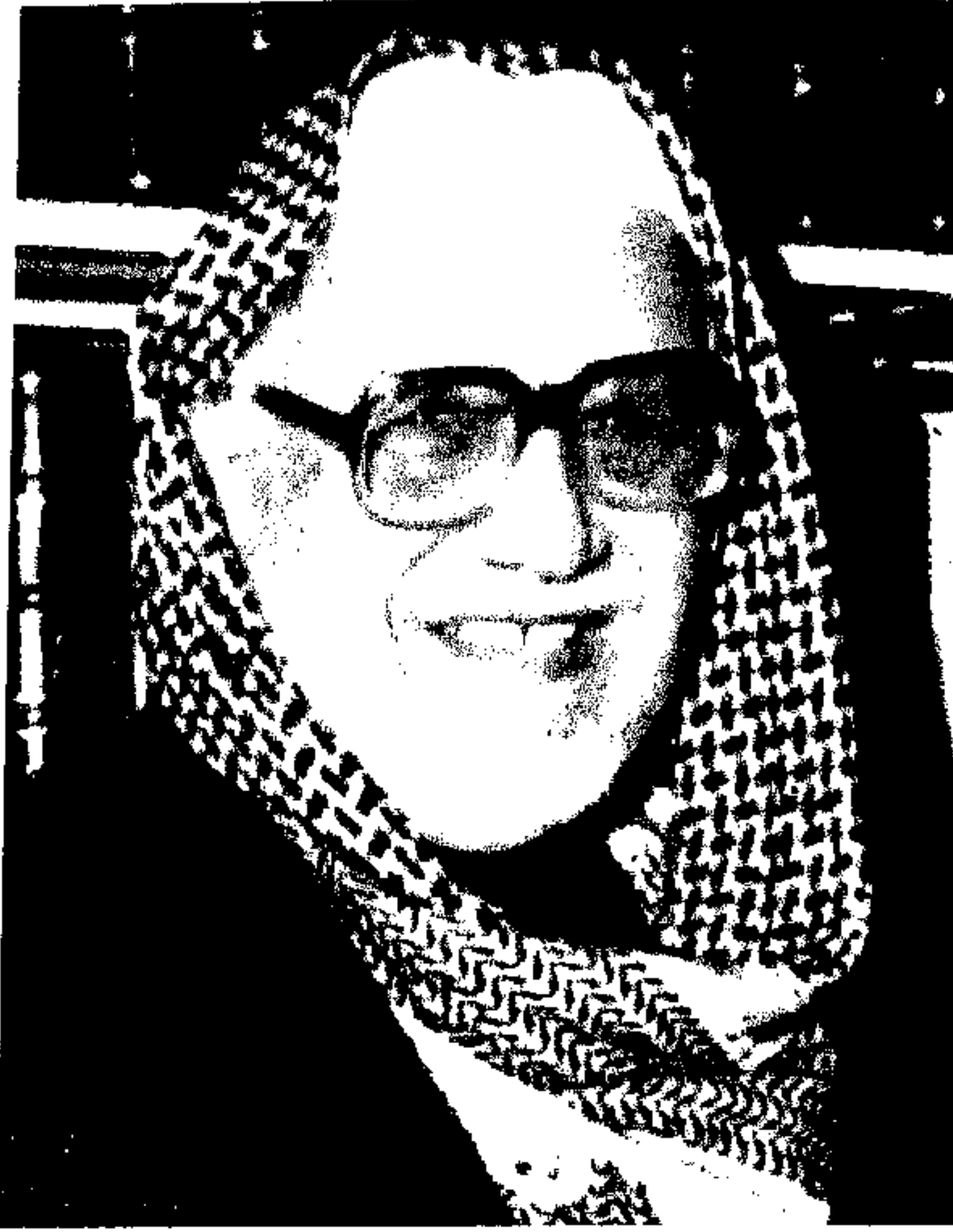
المغفور له الشيخ حمد الجاسر