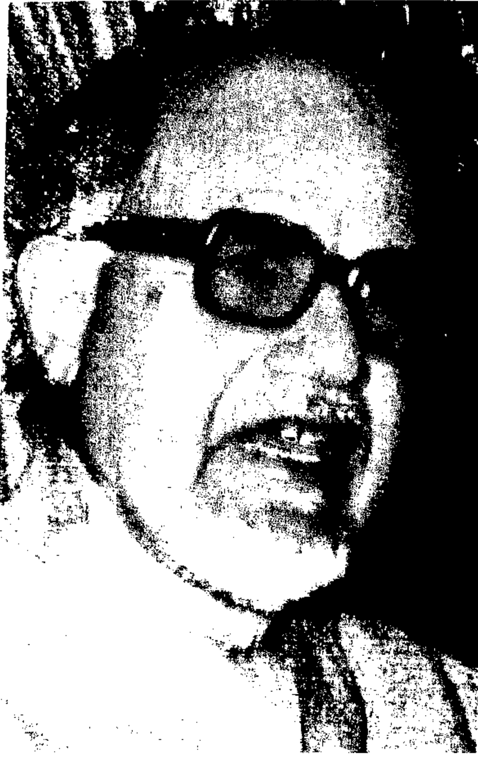
الشيخ حمد الجاسر علامة الجزيرة العربية في نعمة الله

وكان شديدًا في فضح أخطاء جهلة المحققين، وكان يصرح بأن التحقيق في عصرنا هذا يعاني من مشكلات كبيرة نتيجة عدم إلمام قسم من الذين يقومون به بقراءة المخطوطات، ويؤدي هذا إلى تحريف وتصحيف، وفي ذلك إضرار بالتراث؛ لأنه ليس ملكاً لقطر من الأقطار. يقول في مقابلة معه: «... بل هو ملك للأمة العربية، كل الأمة العربية الإسلامية، وتراثنا إذا لم نخرجه إخراجاً صحيحاً محققاً تحقيقاً تاماً، كأنما أخرجنا شيئاً مشوهاً، وشوهنا هذا التراث، ويعد هذا جريمة، ومع الأسف أن كثيراً من المعنيين بتحقيق التراث أصبحوا الآن بدرجة من الضعف لا يستطيعون معها مواصلة عملهم، وظهر أناس آخرون لا يفهمون شيئاً في أعمال التحقيق».