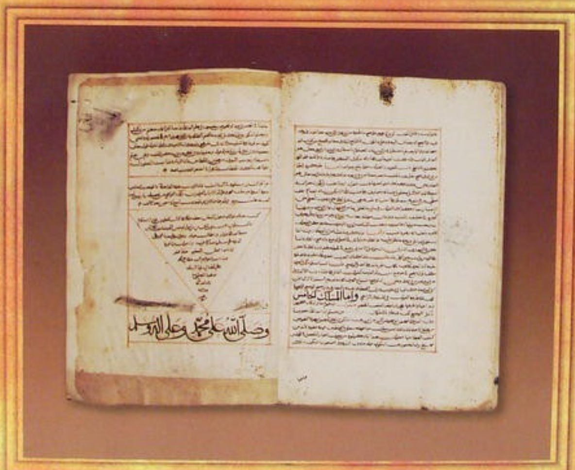
Manuscript : Al-Kashef Libasa'er Al-Akias Lerrassas (656 H) -Written in 1079 H.

مخطوط: الكاشف لبصائر الأكياس: للرصاص (- ٦٥٦ هـ) - تاريخ نسخه (١٠٧٩ هـ)