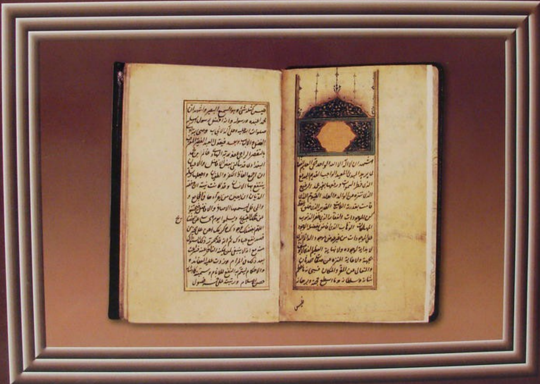
مخطوط حصن الإسلام: لغياث الدين البغدادي (١٠٧٩ هـ) تاريخ نسخه (١٠٩٠ هـ)

Volume 10 : No. 40 - Shawaal 1423 A.H. - January (Kanoon Al Thani) 2003