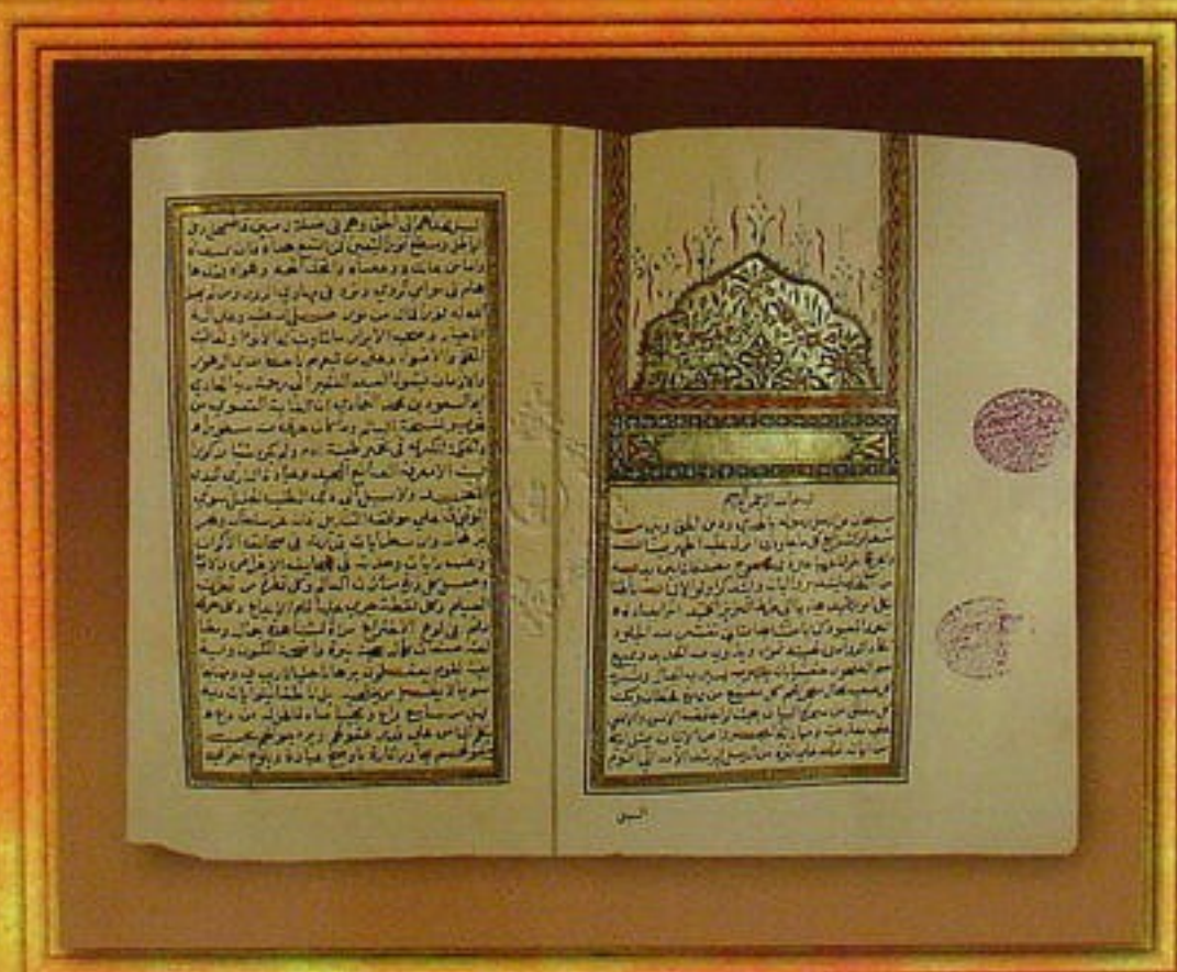
Book of "Rahsad Al Aql A'ssalim" by Abi Suod Bin Mohammed Al Emadi - Calligraphic copy

كتاب « رشاد العقل السليم » لأبي سعود بن محمد العمادي - نسخة مزخرفة