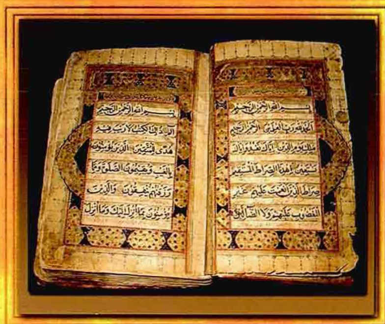
Golden Holy Quran from Manuscripts store of Al-Beruni Institute of Oriental Studies in Uzbekistan