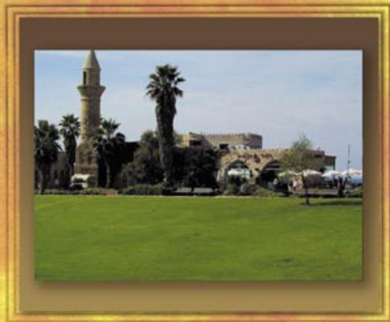
Mosque on Qesarya Beach - Palestine