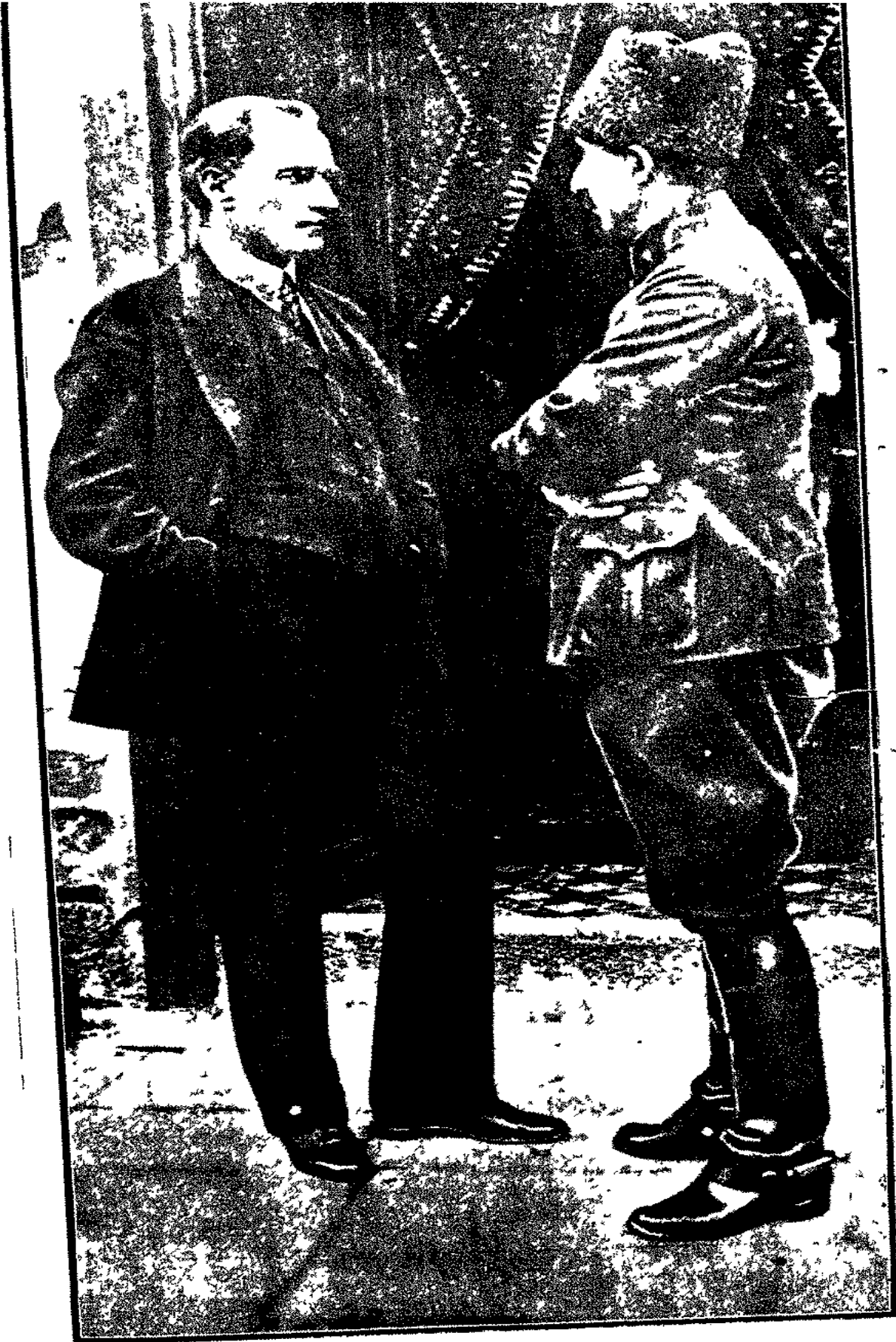
الغازي مصطفى كمال بشيايه الملكية وعصمت باشا احد قواده بشيايه العسكرية