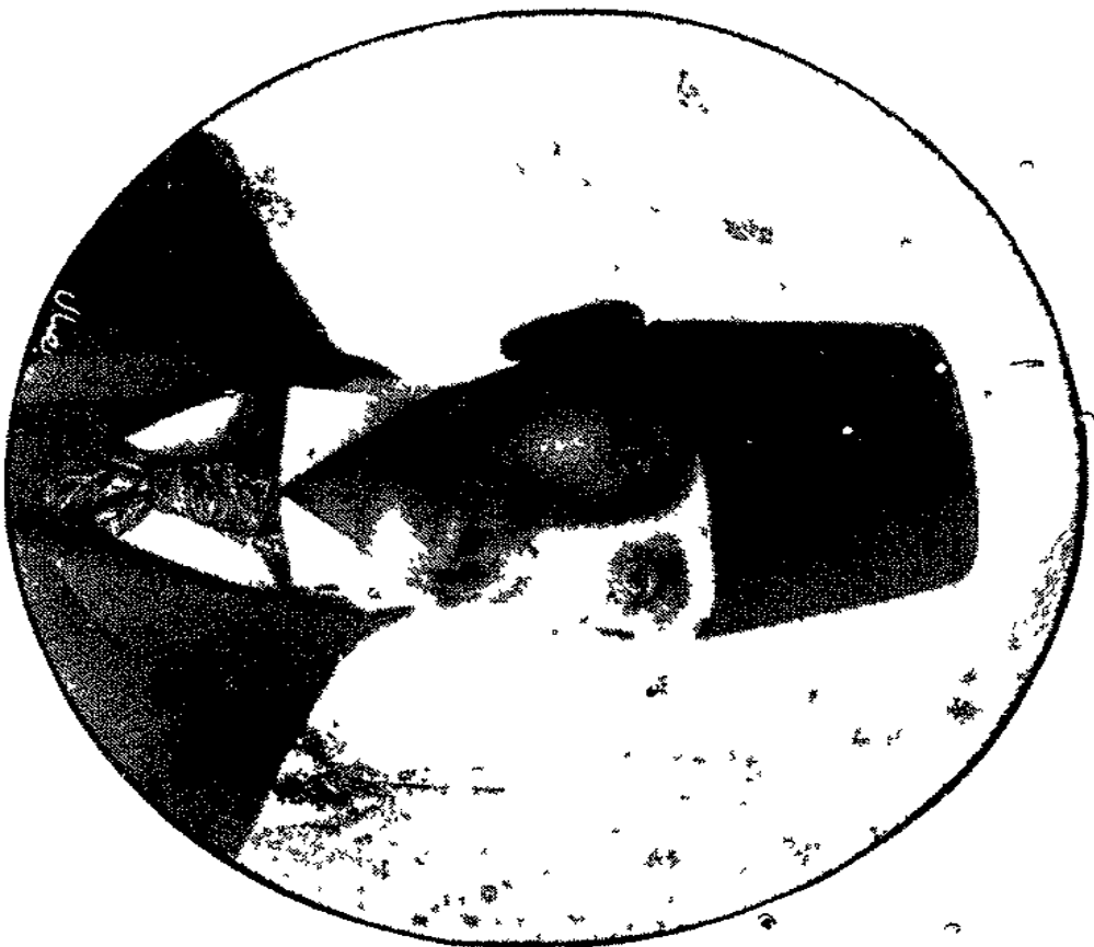
الدكتور امين بك ابو خاطر