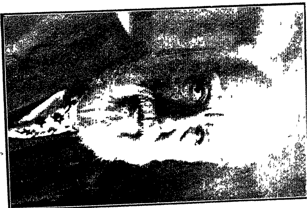
الدكتور غرام بل