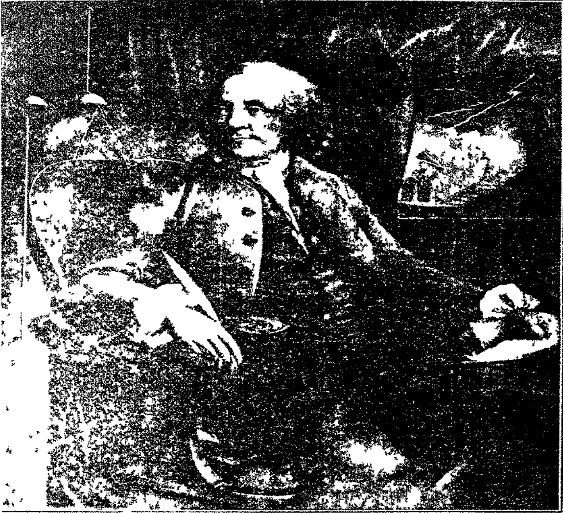
صورة بنيامين فرنكاين منقولة اصلاً عن صورة ماسون تشمبرلين