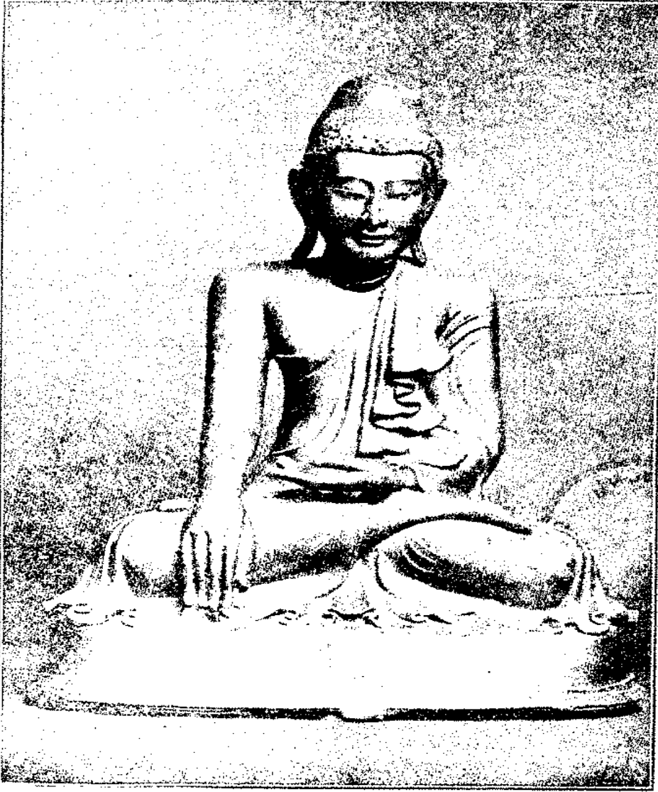
صورة تمثال بوذه جالساً يتأمل وهو من النحاس (البرنز) مرصع بالحجارة الملونة حول رأسه