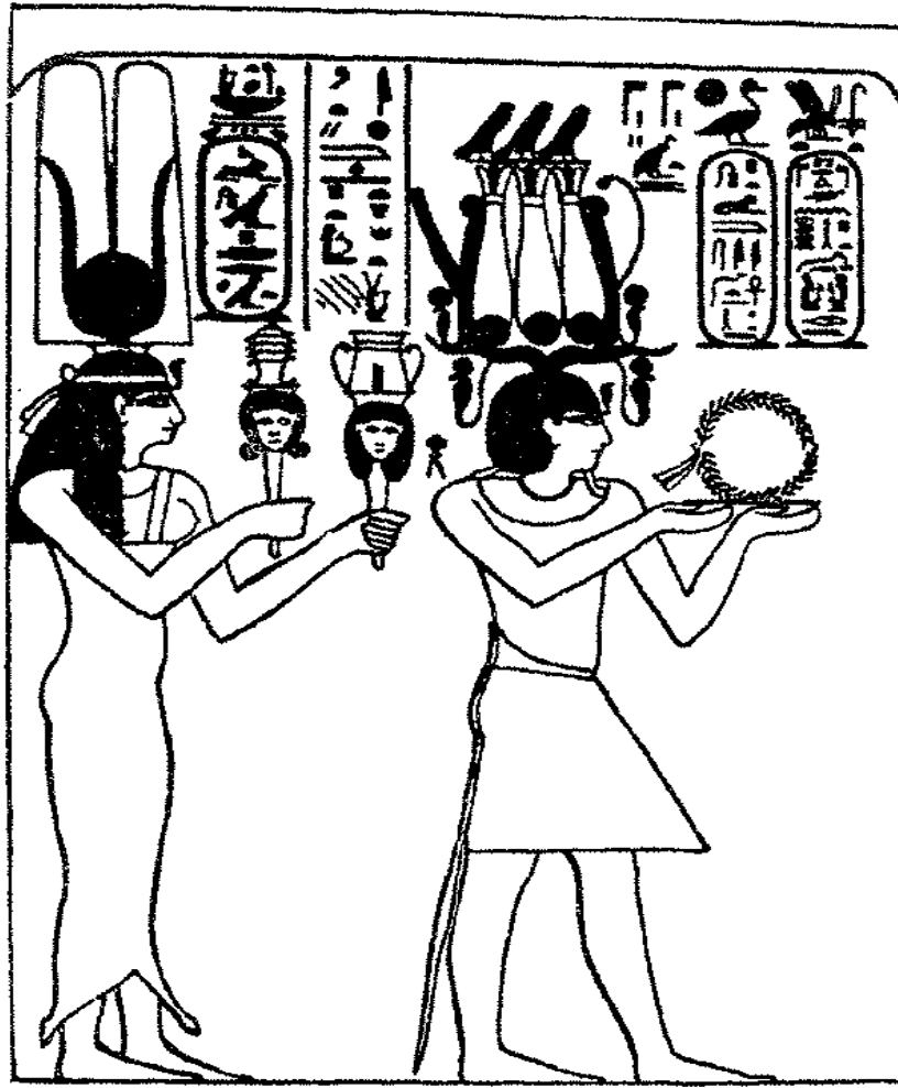
بطليموس السابع يقدم اكليلاً وزوجته كليوباترة تقدم خشنتين