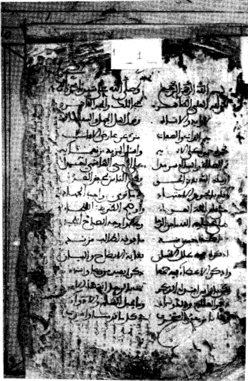
• الصفحة الأولى من المخطوطة.