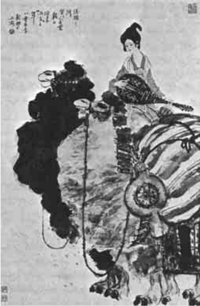
طريق الحرير بريشة دا دون بانغ

الأمر بعلاقاتهم بالعرب أو المسلمين، أو بغيرهم.