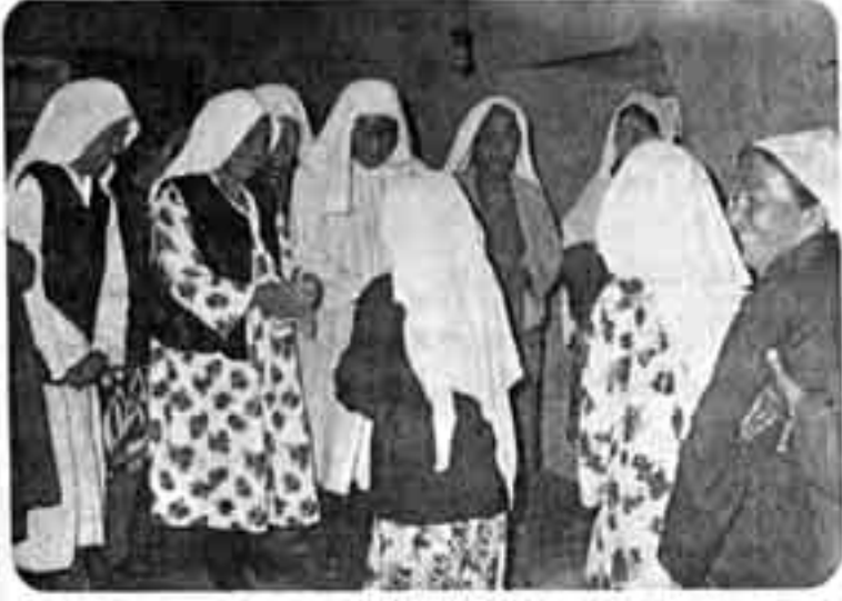
سيدات الأسرة والحي يهنئن أم العروس . ملامحهن لا تختلف بأي حال عن أي مجتمع شرقي مما نعرفه .