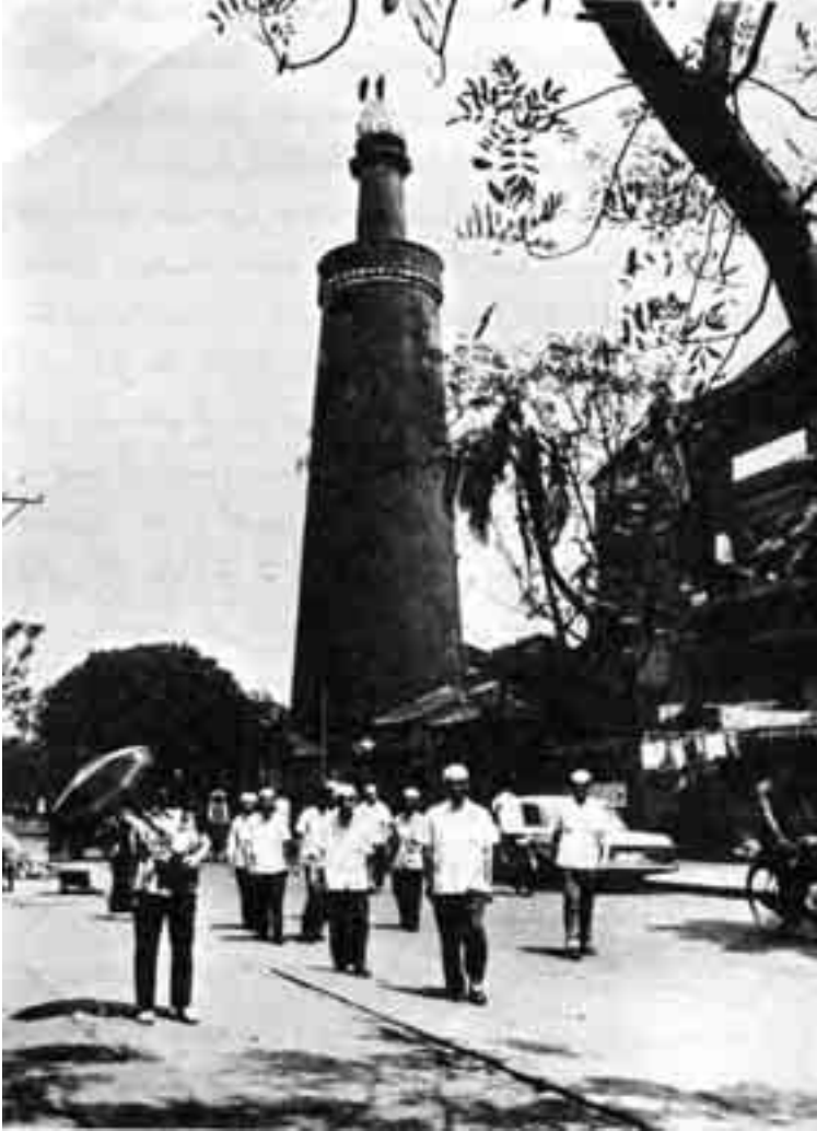
مسجد كانتون «شوق النبي»، اوكونتا-كما يسمونه-وهو واحد من أقدم ثلاثة مساجد في الصين. بني في عهد أسرة تانغ قبل 1000 سنة.