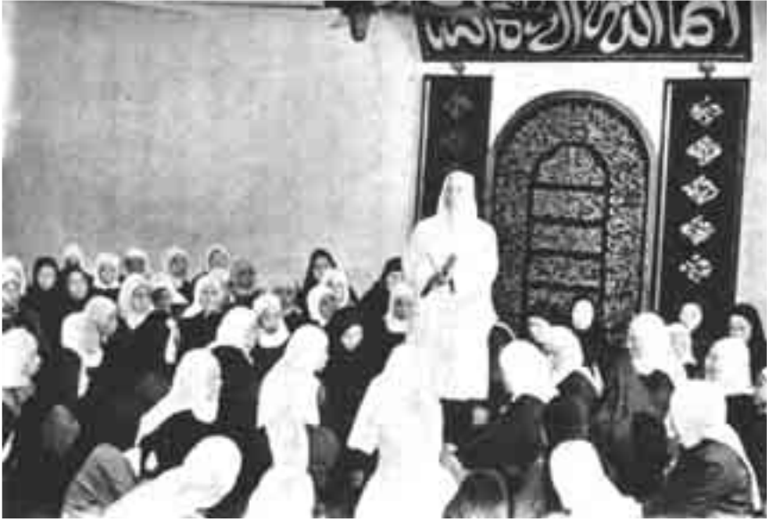
صورة تذكارية لفترة ما بعد التحرير مباشرة حيث كان للنشاط الإسلامى بقية، والصورة لسيدة تعظ أخريات فى أحد مساجد شنغهاي.