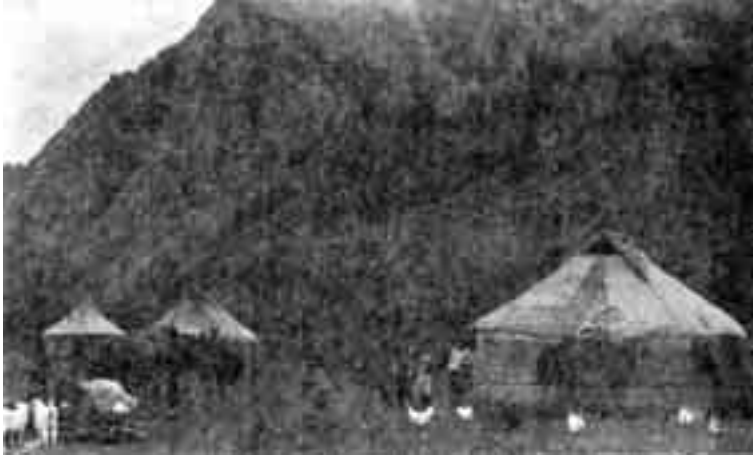
خيام القازاق المسلمين منتشرة في شمال وشرق الصين، ومضاربهم حيث العشب والمراعي.

ولأن مسلمي سينكيانغ الويغوريين شديداً التمسك بتقاليدهم الإسلامية، تماماً مثل مسلمي يوننان الهويين، فقد فشلت عمليات التهجير-برغم حجمها الكبير نسبياً-في أن تحقق هدف خلخلة هذه المجتمعات الإسلامية المتماسكة. حقا لقد أصبح مسلمو يوننان «أقلية» في المقاطعة، بسبب التهجير من ناحية ونتيجة للمذابح وعمليات الإبادة التي جرت من ناحية أخرى، ولكن تدهور أعدادهم لم يؤثر على تمسكهم بالتقاليد الإسلامية الراسخة في أعماقهم.