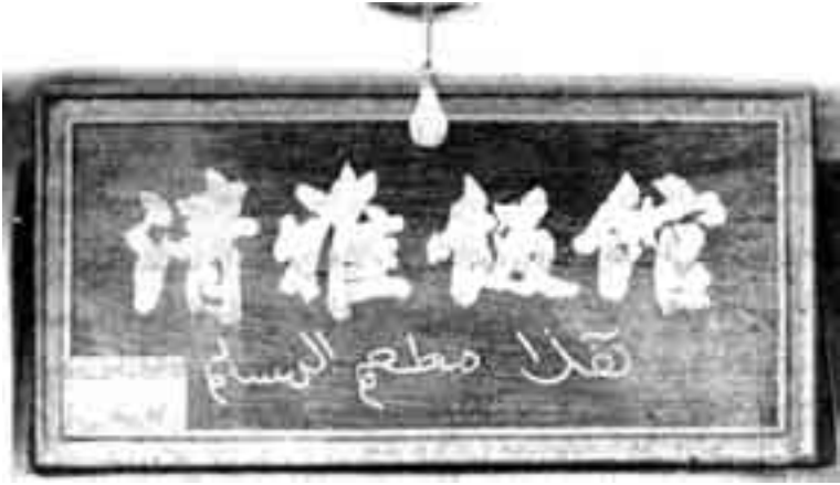
لافتة مطعم إسلامي في الصين.

العبارات. حتى بلغ عدد المطاعم التي من هذا النوع حوالي 65 مطعمًا في بكين، و55 في شنغهاي.