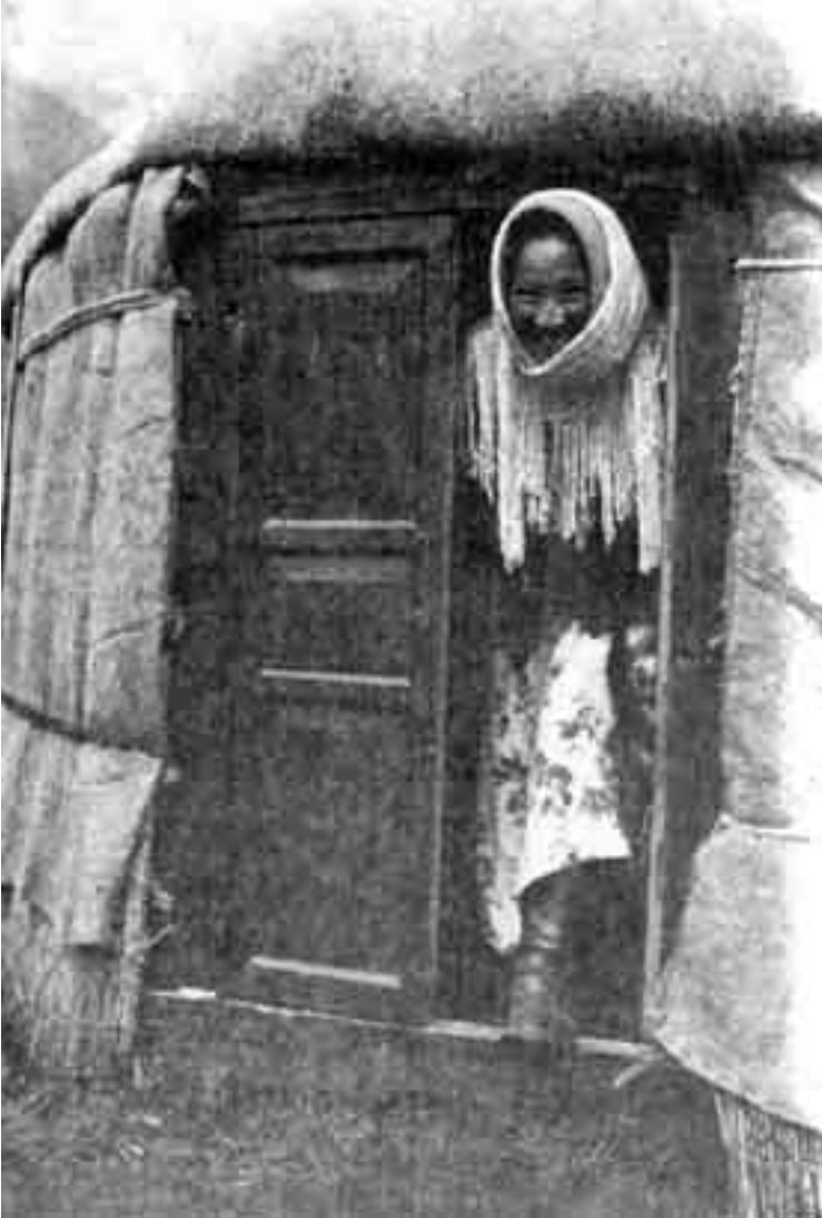
قازاقية أطلت علينا من باب الخيمة وابتسمت للكاميرا .