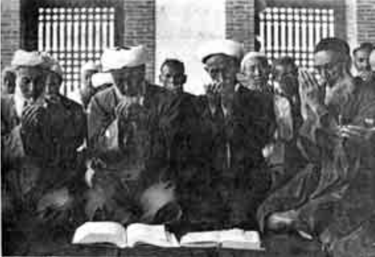
الرجال يقرءون الفاتحة بعد خطبة النكاح، ليبارك الله في الزواج و يطيل عمر العروسين .