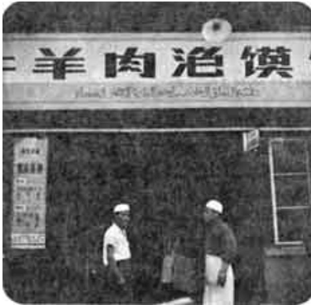
مطعم إسلامي في الصين.