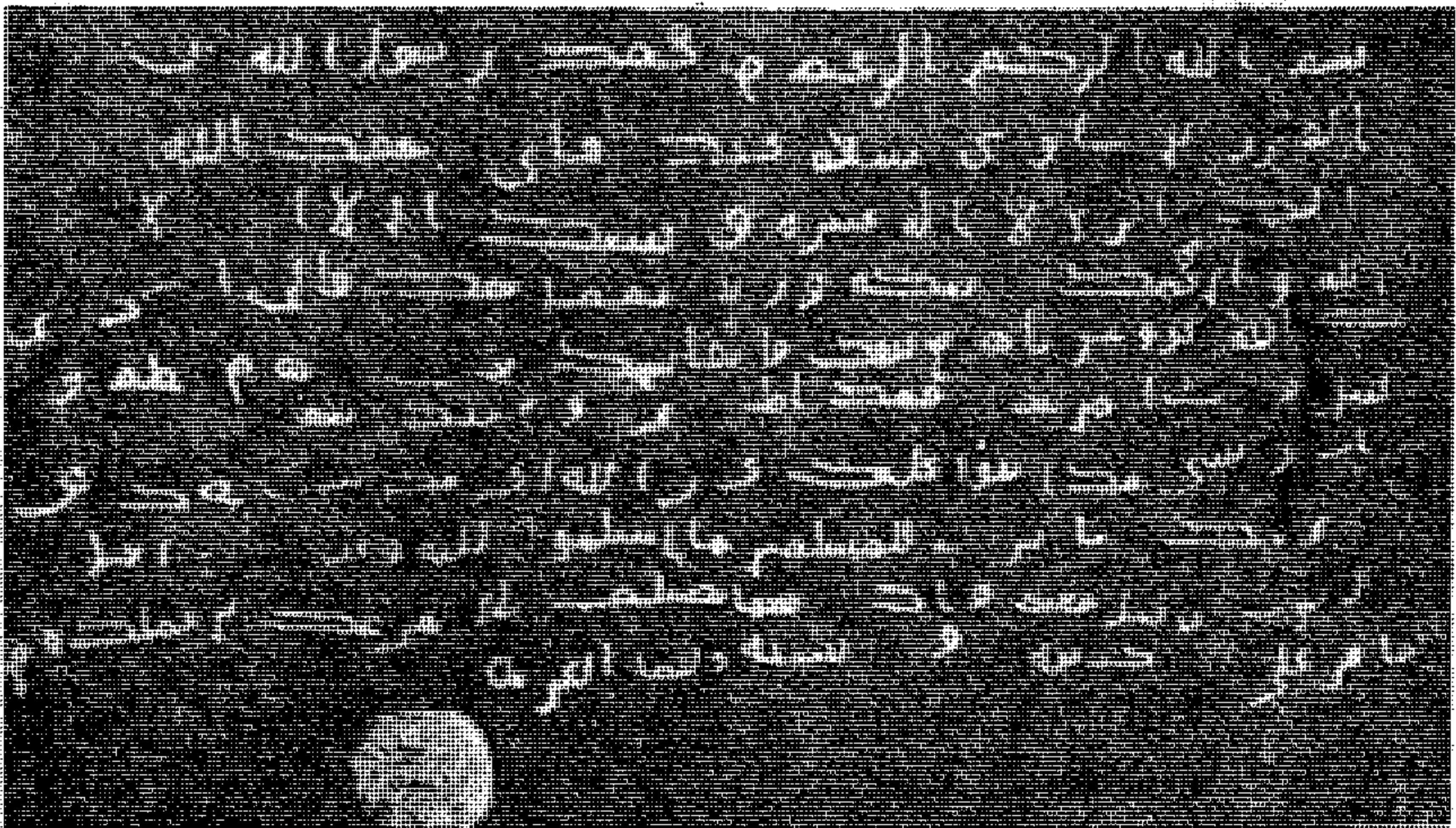
رقم ( ١٠ ) رسالة رسول الله إلى المنذر بن ساري